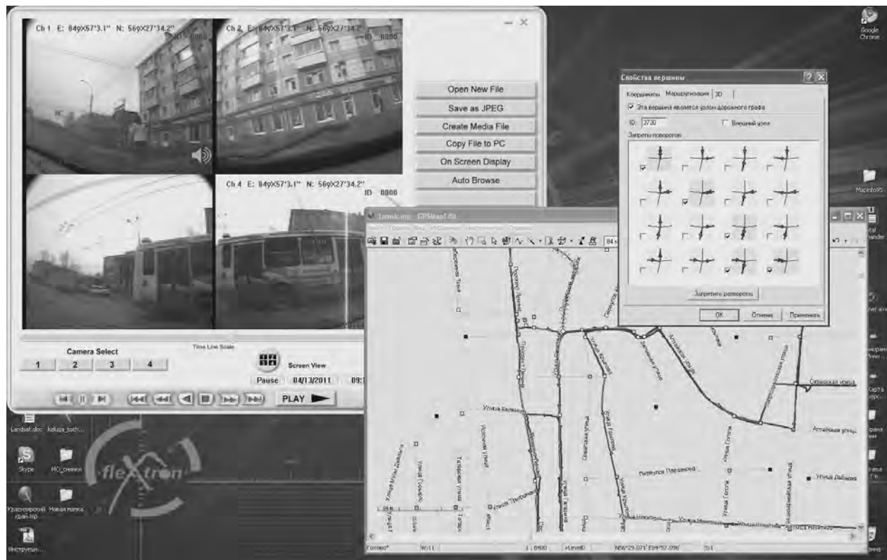
Рис.3 Обработка видео с объездов

На данный момент решению того, какой должна быть та или иная карта, сколько она должна содержать элементов, какое количество объектов должен содержать каждый слой, не предшествуют картографические расчеты. Чаще всего эти характеристики определяются либо случайно, либо зависят от назначения карты, качества ИКМ, требований заказчиков. Благодаря научным разработкам в области геоинформационных систем можно повысить качественный уровень создаваемых ЦНК путем использования рассчитанных показателей нагрузки и густоты элементов карты в соответствии с необходимым масштабом. Данные разработки делают процесс создания карты более технологичным и обоснованным с научной точки зрения, и в то же время упрощают процесс, так как используются универсальные показатели. В этом отношении функция автоматического определения нагрузки слоев карты при переходе от одного масштаба к другому является уникальной технологией.