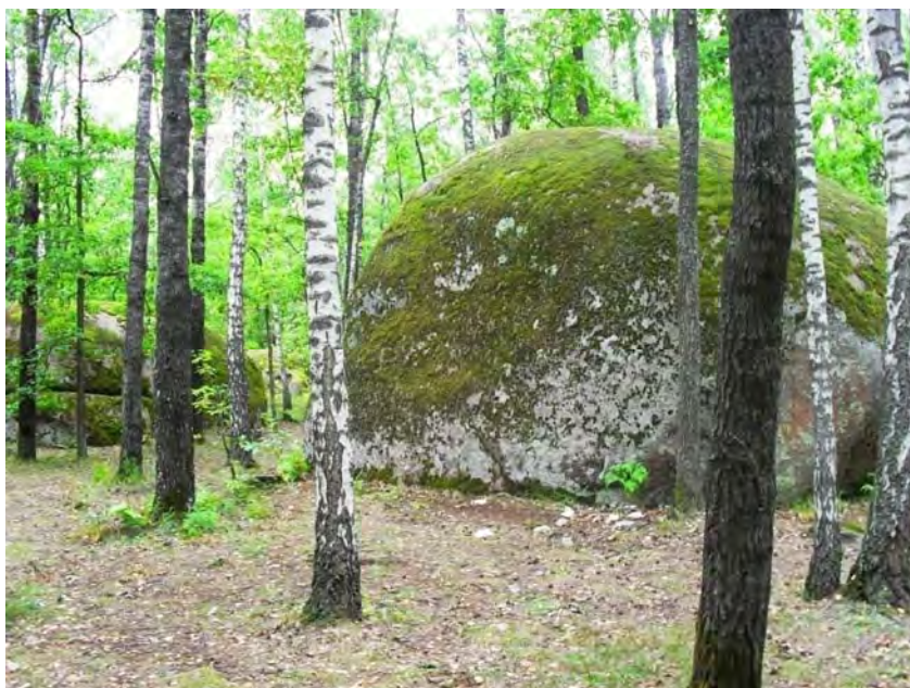
Камінне село. «Жертовний камінь» с. Рудня-Замисловецька Олевського р-ну Житомирської області