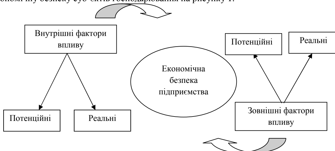
Рис.1 Узагальнена схема економічної безпеки підприємства

Існує низка дефініцій цієї економічної категорії, однак, ми вважаємо, що найбільш ґрунтовно зміст «економічної безпеки» трактує О.В. Ареф'єва, де описано це явище як такий стан корпоративних ресурсів (ресурсів капіталу, персоналу, інформації і технологій, техніки та устаткування, прав) і підприємницьких можливостей, за якого гарантується найбільш ефективно їхнє використання для стабільного функціонування та динамічного науково-технічного й соціального розвитку, запобігання внутрішнім і зовнішнім негативним впливам (загрозам) [2, с.98]. Схематично проілюструємо економічну безпеку суб'єктів господарювання на рисунку 1.