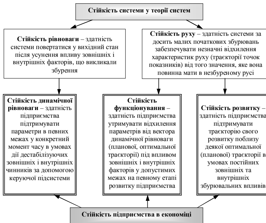
Рис. 2. Інтерпретація поняття «стійкість системи» в економіці стосовно підприємства

Кожна система для забезпечення її ефективного функціонування в перспективі повинна не лише кількісно змінюватись, а розвиватись. З позицій теорії систем та концепції самоорганізації розвиток системи (підприємства) передбачає значні якісні зміни її структури (складу та зв'язків) та режиму функціонування. Не слід ототожнювати поняття росту та розвитку системи, оскільки перше передбачає лише кількісні зміни значень параметрів системи. Проте в ході розвитку системи можуть змінюватись не лише її структура та механізм функціонування, а й види діяльності і темпи її росту.