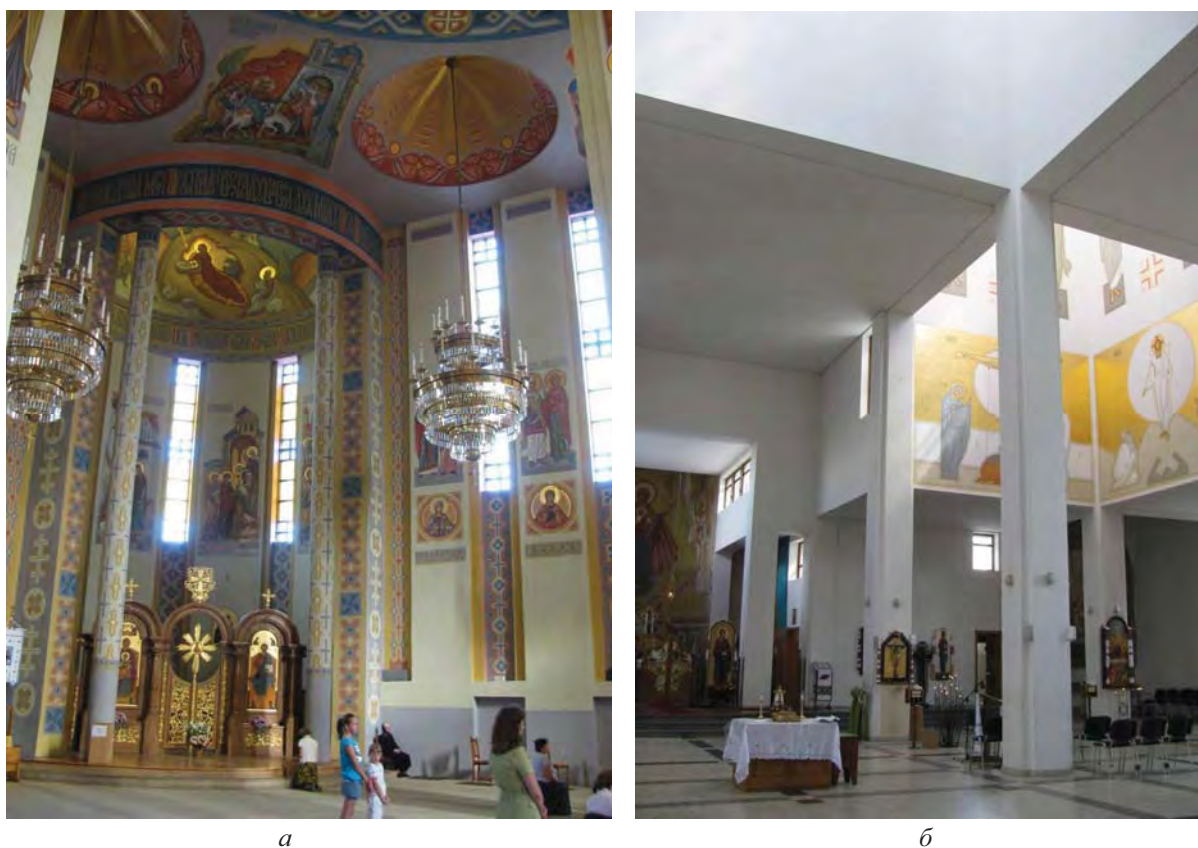
Рис. 3. Сучасна епоха: а – церква свв. Володимира і Ольги у Львові; б – церква Різдва Пресв. Богородиці у Львові

просторів, що “розбігаються” у різних напрямках. Завдяки зіставленню поверхні стін зі золотом мозаїк світло вібує, повітря перетворюється у колір, стіна губить масу-вагу, простір також перетворюється на колір. І незважаючи на надзвичайну величину їх обсягів, вони “зникають”, і нам здається, що ми спостерігаємо неогорнутий простір, оскільки світло падає на стіни, і їх текстура перетворюється на колір. Тобто ми усвідомлюємо, що світло, форма і текстура нероздільні компоненти, коли вони представляються як з’єднання світла і форми. Світло є інструментом-засобом для демонстрації виражальних можливостей матеріалу. Простір знаходиться під дією світла, і саме текстура не тільки виявляється під дією світла, але й сама перетворюється на світло. Адже вона – це не тільки матеріал, але й організація обсягів у просторі. Світло встановлює свою владу над сприйняттям форми, підкреслюючи її зовнішній прояв і внутрішню сутність [7] (рис. 3).