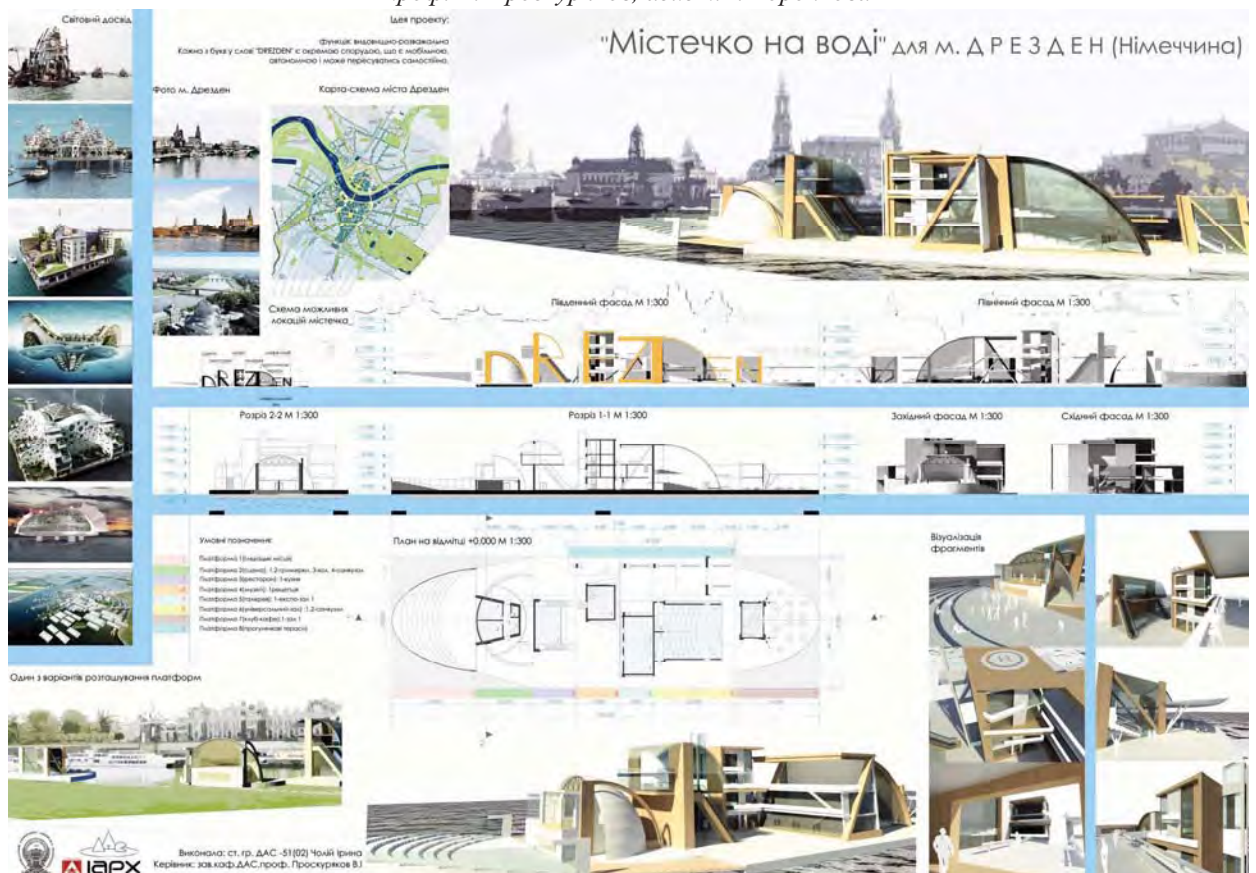
Рис. 4. Проект плавучого культурного центру «Містечко на воді» у м. Дрездені, автор ст. І. Чолій, керівники: проф. В. Проскураков, доц. Б. Гой