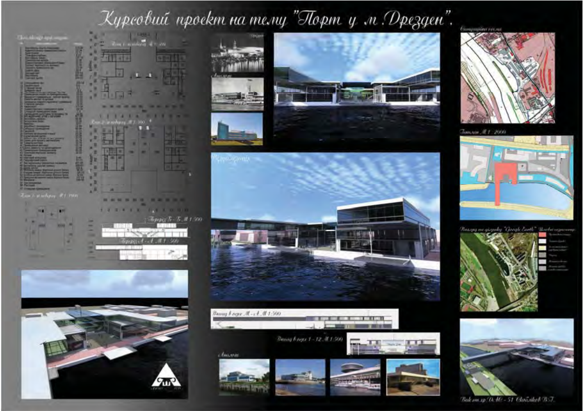
Рис. 2. Проект реновації і розвитку функцій річкового порту у м. Дрездені, автор: ст. В. Скобліков, керівники: проф. В. Проскураков, доц. Б. Гой