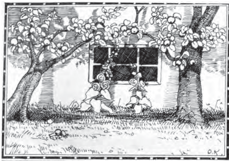
Рис. 1. Основну ідею української архітектури, яка полягає у екологічному єднанні з природою, дуже стисло і лірично виразила Олена Кульчицька в одній з своїх ілюстрацій до української народної казки (1916–1917 рр.)