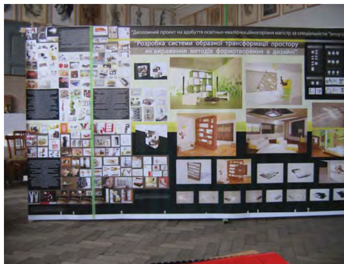
Рис. 21. Дипломні проекти на здобуття освітньо-кваліфікаційного рівня «магістр» напрямку «Графічний дизайн» та «Інтер'єр та обладнання»:

а – магістерська робота за спеціальністю «Інтер'єр та обладнання» “Нові тенденції у формуванні візуальної комунікації та організації предметного середовища вітрин магазинів”.