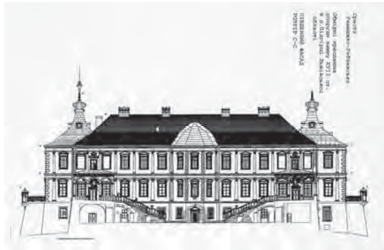
Рис. 18. Каталог виставки про дослідження Підгорецького замку та обмірні креслення