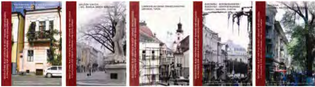
Рис. 19. Серія книг за шведсько-українсько-молдвським проектом

У всіх наукових темах і проєктах бере участь колектив викладачів і студентів кафедри дизайну та основ архітектури (рис. 20, 21).