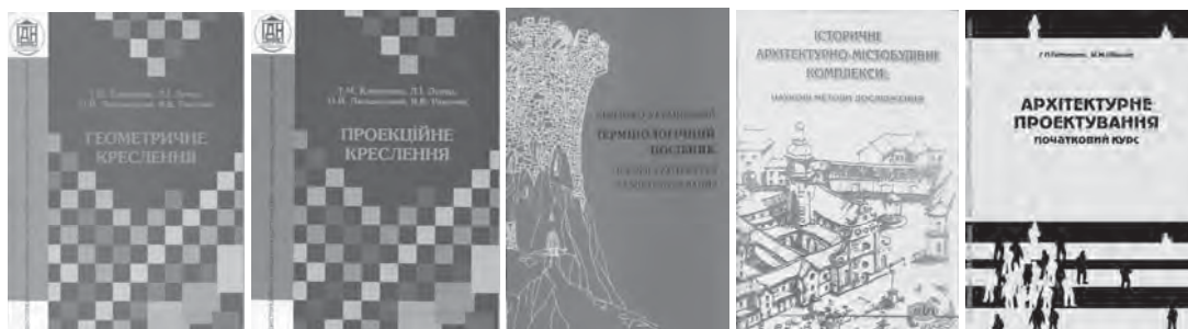
Рис. 9. Титульні сторінки навчальних посібників та підручників, рекомендованих та затверджених Міністерством освіти і науки України, підготованих викладачами кафедри