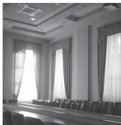
Рис. 15. Обладнання інтер'єру кабінету ректора та сесійної зали. Я.В. Ракочий, 2008 р.