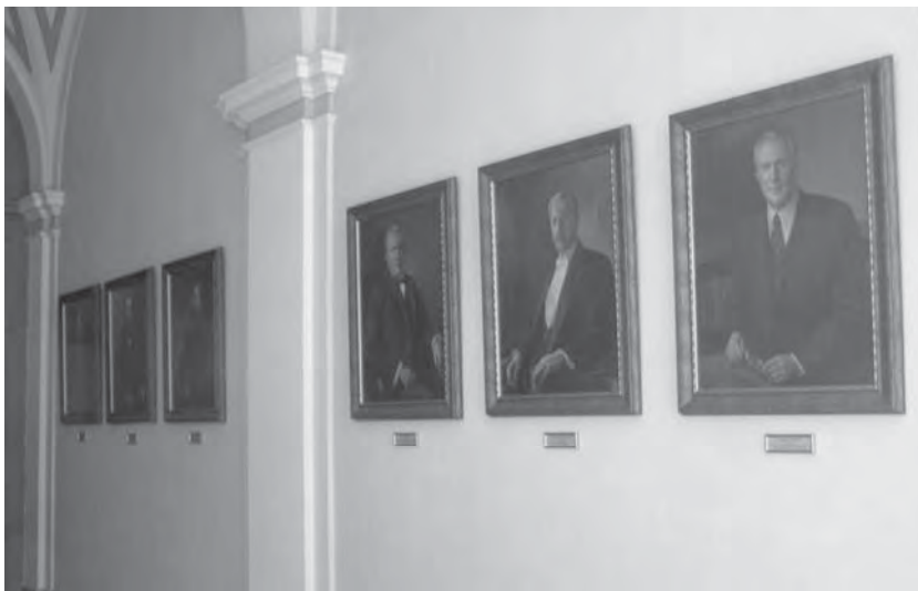
Рис. 14. Галерея ректорів Львівської політехніки – автор В.О. Штець, 2009 р.