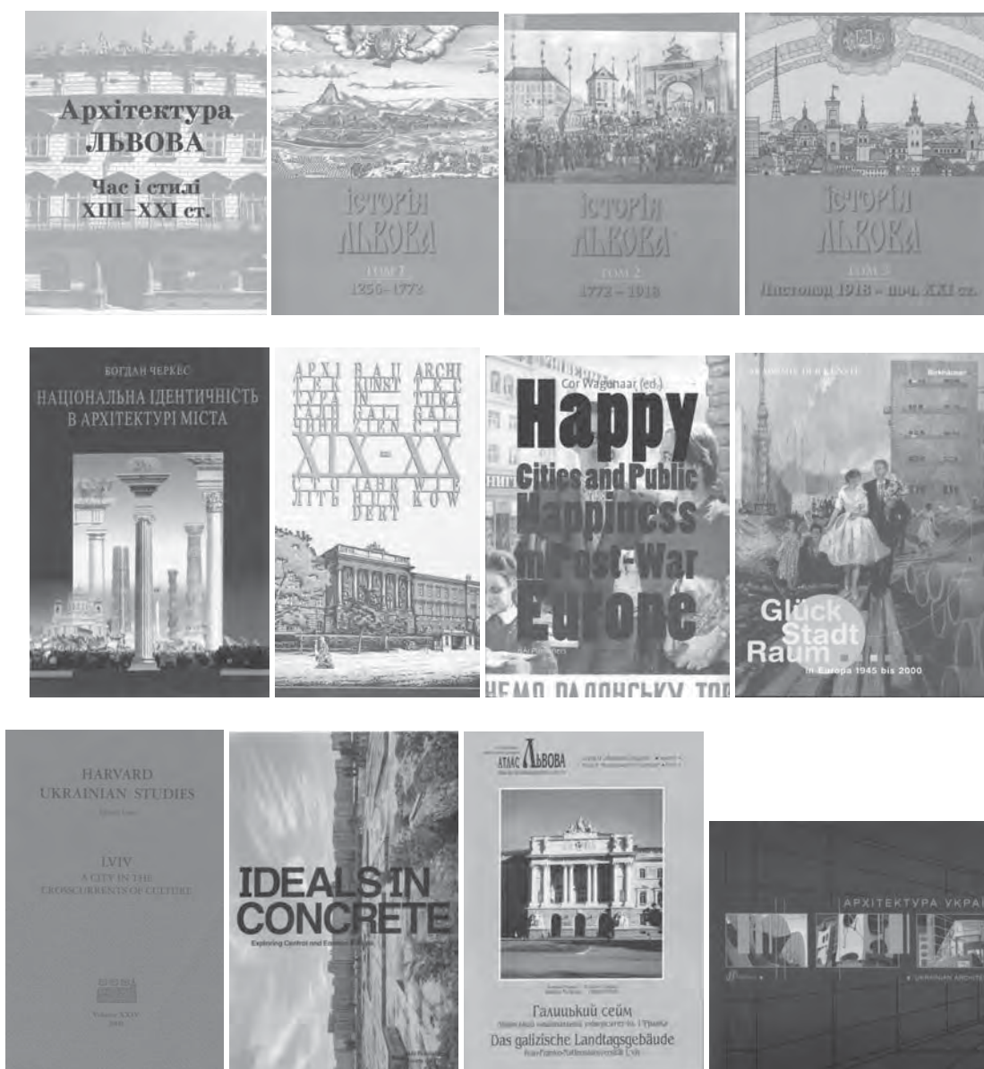
Рис. 5. Титульні сторінки монографій та важливіших публікацій вчених кафедри

У межах проблематики основного наукового напрямку кафедри представники наукової школи під керівництвом проф. Б.С. Черкеса проводять наукові розробки спеціалізованих тем.