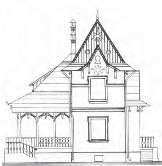
Рис. 1. Приклад садиби підавстрійського періоду. Вілла Геллера (Hellera) на вул Мельника. Арх. А. Богочвалські (A. Bogochwalski)

забудовували три- чотирповерховими прибутковими будинками, що було значно рентабельніше з огляду на високі ціни на землю. Більш характерним для розвитку садибної забудови Львова в останній третині XIX ст. було будівництво великими ділянцями на південних та південно-східних околицях Львова.