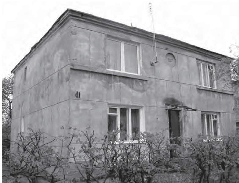
Рис. 3. Приклад «самодіяльного» будівництва радянського періоду. Житловий будинок на вул. Я. Музики, 41