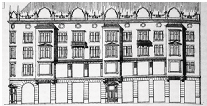
Рис. 1. Будинок універмагу «Траст», арх. М. Лужецький

Прикладом такого будинку може бути універмаг «Траст» на площі Ринок за проектом архітектора М. Лужецького [5] (рис. 1). Тут риси львівської ідентичності проглядають у ренесансних аркових поясах, аттиках та масованому русті, а належність до нової історичної доби – у великих масивах скла та функціональності планування.