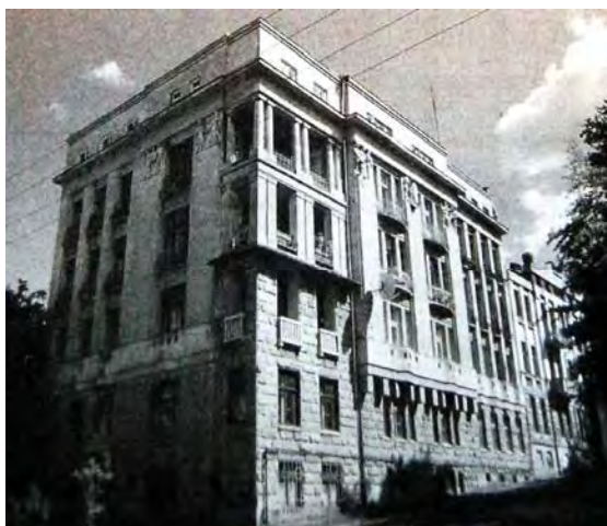
Рис.2 «Кам'яниця Пінкерфельда»