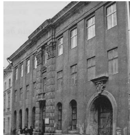
Рис. 5. Будівля видавництва «Новий світ» на вул. Ковжуна, 10

Отже, характерні прийоми творчого методу львівського неоісторизму, розроблені на початку ХХ століття, продовжували існувати і протягом міжвоєнного періоду, коли в СРСР вже набував поширення сталінський стиль. Прикладом такої архітектури є будівля видавництва «Новий світ» на вул. Ковжуна, 10 (рис. 5), арх. Червінський, в якій характерно поєднано лаконічні стіни і недекоровані вікна із насиченими рустованими пілястрами, які завершені масивними капітелями. У споруді відчувається монументальність та стримана респектабельність офіційного типу.