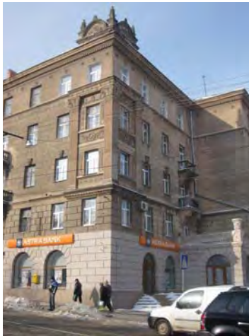
Рис. 4. Житловий будинок на розі вулиць Я. Мудрого, 1 та Городоцької, 48