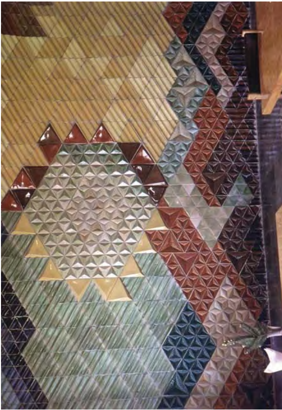
Рис. 1. Т. Левків. Панно в інтер'єрі кафе заводу "Енергоремонт" (1982)