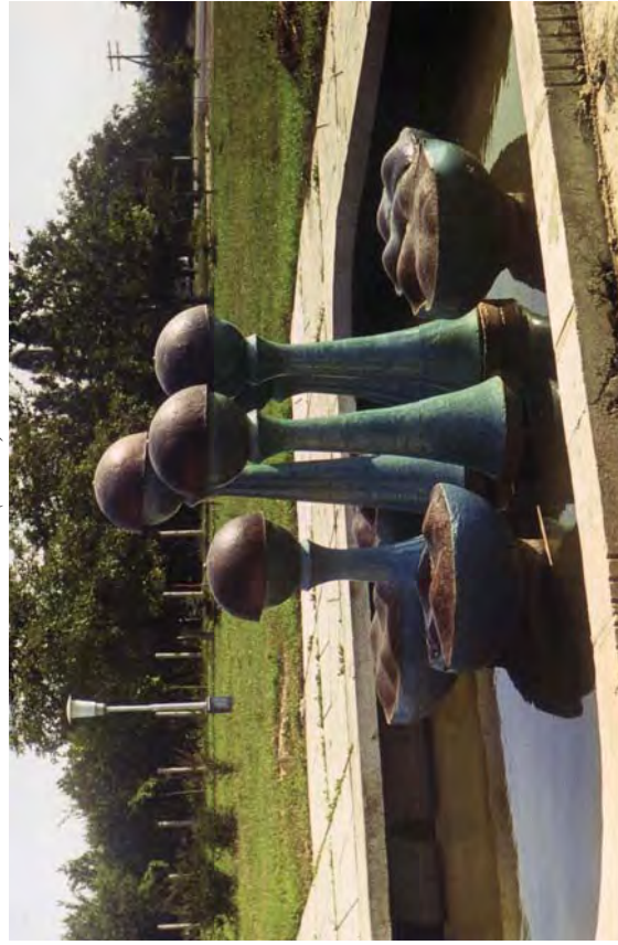
Рис. 4. Т. Левків. Фонтан для дендропарку Заводу "СТО" (1982)