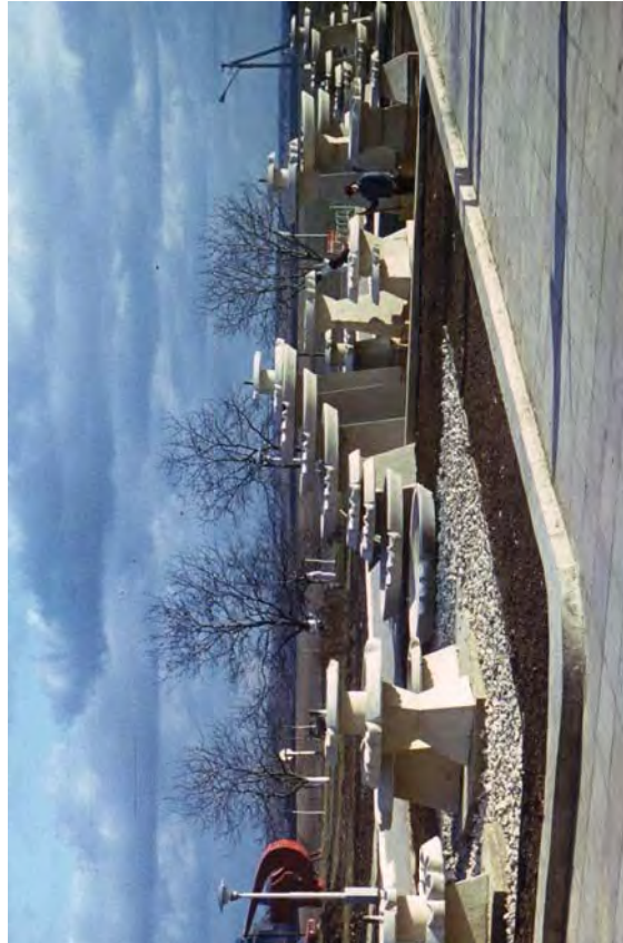
Рис. 3. Т. Левків. Фонтан на території Заводу "СТО" (1981)