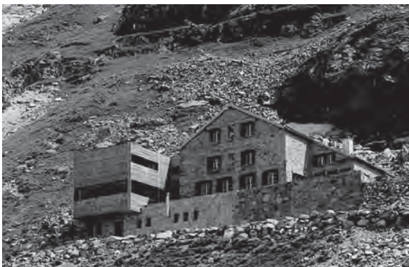
Рис. 3. Туристичний притулок біля гори Чірва, Швейцарія. Стара будівля і сучасна прибудована частина.