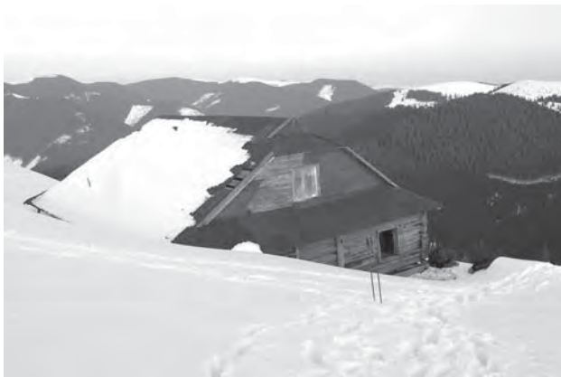
Рис. 12. Гірська хатина вівчарів прихисток для туристів на хребті Чивчин