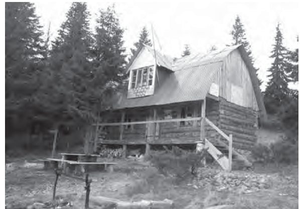
Рис. 13. Новозбудований туристичний притулок на місці колись існуючого притулку на полонині Плісце під г. Трофа (1748 м) у Гортанах.