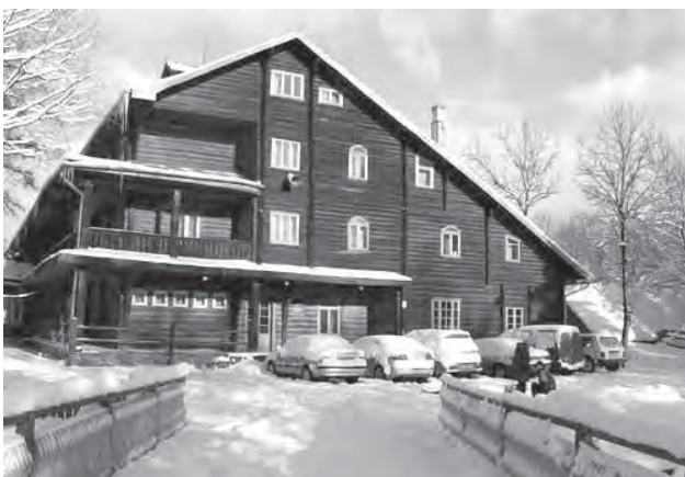
Рис. 9. Туристична база «Едельвейс» в смт. Ясиня Рахівського р-ну Закарпатської обл.