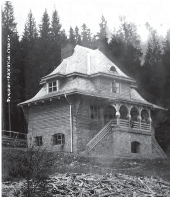
Рис. 7. Туристичний притулок, що існував біля г. Молода в масиві Горгани.

З часу української незалежності помітних зрушень у сфері будівництва гірських туристичних притулків не спостерігається. Трапляються поодинокі спроби налагодження туристичної інфраструктури і зокрема відновлення функціонування туристичних притулків на попередніх місцях – притулок на полонині Плісце між г. Грофа (1748 м) та г. Паренки (1736 м) у Горганах (рис. 13). Дуже активне і часто непрофесійне будівництво готелів у поселеннях.