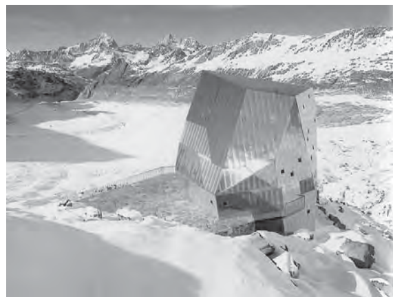
Рис. 2. Притулок «Монте Роза» (2795 м), Швейцарія.