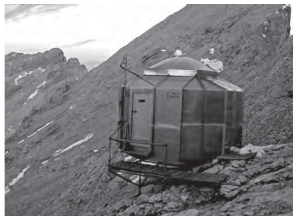
Рис. 6. Притулок-бівак «Карл-Шустер». Тіроль, Австрія.