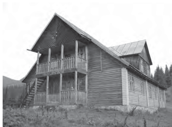
Рис. 10. Туристичний притулок «Драгобрат» у масиві Свидовець біля г. Близниця (1881 м) Рахівського р-ну Закарпатської обл.