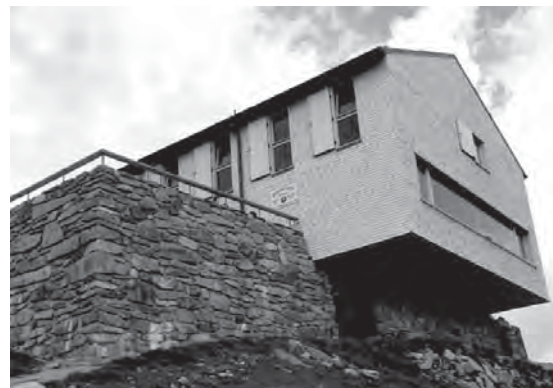
Рис. 4. Притулок «Ольперергютте» (2389 м) на старій основі біля г. Ольперер, Тіроль, Австрія.

За архітектурним виразом гірські притулки на початках свого виникнення були близькими до місцевих будівельних традицій. В останній час спостерігається стилістичне віддалення від традиційних місцевих форм. Спільною рисою усіх гірських туристичних притулків є проста