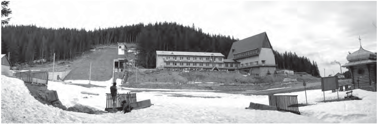
Рис. 11. Спортивно-готельна база «Заросляк» в містечку Ворохта-Завося, Надвірнянський р-н Ів.-Франківської обл.