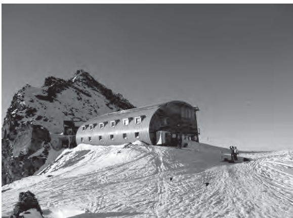
Рис. 1. Туристичний притулок «Штюдльгютте» (2801 м) біля г. Гросльокнер, Австрія.

Переважно гірський туристичний притулок має вигляд компактної одно-, дво- чи триповерхової споруди для проживання великої кількості людей. Виконуються гірські притулки найчастіше з доступних місцевих будівельних матеріалів (природний камінь, цегла, дерево). Тепер часто застосовують новітні ефективні теплоізоляційні матеріали; метал стає все більш поширеним, як несучий матеріал, а також як зовнішнє оздоблення цих будівель. Конструктивна схема може бути різною: зрубна, цільностінова, каркасна і т.д.