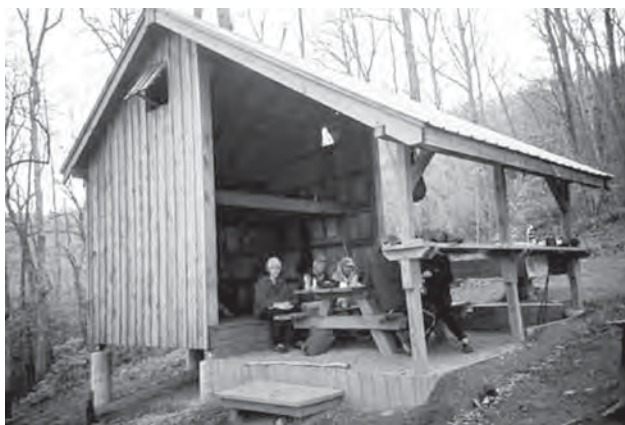
Рис. 5. Захисток для укриття від негоди.

розпланувальна схема, мінімальний зовнішній периметр стін, ефективна система опалення. Помітною є тенденція до використання альтернативних джерел енергії.