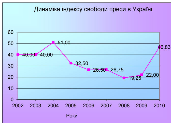
Рис. 1 Значення індексу свободи преси в Україні у 2002-2010 р.р. (в балах)

Порівнюючи індекс свободи преси України з країнами Центрально-Східної Європи, можна зазначити, що після неї у рейтингу розмістилась лише Білорусь. Відповідно до останніх досліджень у 2012 р. Україна посіла 116 місце у світі за Всесвітнім індексом свободи преси з кількістю балів, які становлять 54,00. Динаміку зміни індексу свободи слова за період з 2002 по 2010 рр. представлено на рис. 1 [2].