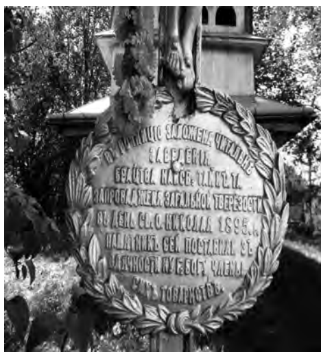
Фото 25, 26. Символічний пам'ятний знак та напис на ньому в с. Тухолька на Сколівщині