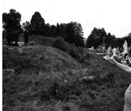
Фото 10. Кутова частина знівельованого оборонного укріплення на Золотій Горі у Верхньому Синьовидному

Загалом на зазначеному кладовищі налічується кілька десятків вертикально поставлених надгробних плит, хоча захоронень є набагато більше. За відомостями мешканців сусіднього села Тершів, багато кам'яних надмогильних пам'ятних знаків з старосамбірського кладовища опинилося в приватному секторі в якості будівельного матеріалу.