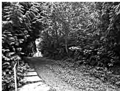
Фото 12. Сучасний вихід на Золоту Гору у Верхньому Синьовидному на Сколівщині

відомо, що чимало давньоруських монастирів мали потужні фортифікації й слугували представникам княжої влади та духовного кліру надійною опорою.