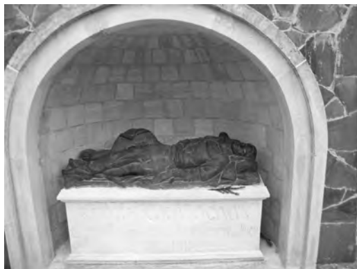
Фото 2. Барельєф з зображенням князя Святослава зі східного боку усипальні

могою сходинок влаштовано з західного боку історичної пам'ятки (фото 1).