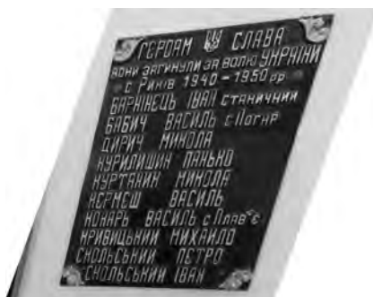
Фото 30, 31. Меморіальний комплекс “Славська Млака” у селищі Славське на Сколівщині та перелік імен героїв, полеглих за волю України

засвідчує існування монастиря. Ще інша гіпотеза твердить, що тут колись було село, яке в XVI ст. спалили татари. Усі версії є вірогідними. З метою встановлення істини пам'ятку необхідно детально дослідити на рівні використання різних джерел. Унікальний та порівняно рідкісний за присвятою металевий хрест виявлено на церковному дворі поблизу дзвіниці в с. Тухолька, що на Сколівщині. Напис на поминальній табличці свідчить, що даний пам'ятний знак встановлено в день святого Миколая (19 грудня) 1895 року з нагоди роковин закладення місцевої читальні, а також того, що сільська громада публічно відмовилася від вживання алкоголю (фото 25, 26).