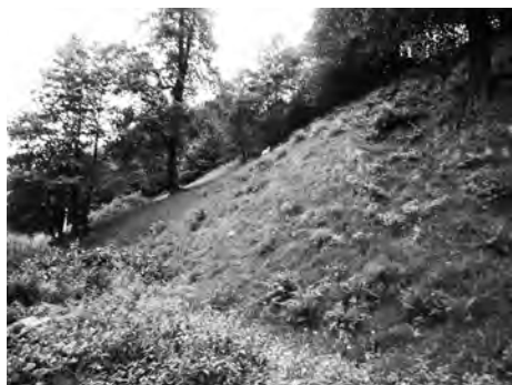
Фото 11. Природний крутосхил Золотої Гори та сучасний вихід на неї у Верхньому Синьовидному на Сколівщині

Наведена літописна інформація дає підстави припустити ймовірність існування в зазначеній чернечій обителі добрих оборонних укріплень. З писемних джерел, а також з результатів наукових досліджень