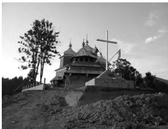
Фото 28, 29. Символічні пам'ятні знаки українським героям-повстанцям у селах Нижня Рожанка та Тернавка на Сколівщині