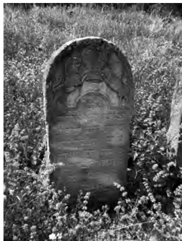
Фото 7. Надмогильні плити на відновленому єврейському кладовищі поблизу Старого Самбора на Львівщині

Поблизу Старого Самбора зусиллями та на кошти колишнього уродженця міста, єврея за походженням, Джека Гарднера, лише в роки незалежної України вдалося відновити стародавнє єврейське кладовище (фото 6).