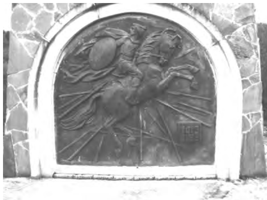
Фото 4. Скульптурна композиція на східній стіні усипальні князя Святослава

На верхню кришку саркофага "покладено" тіло важко пораненого молодого київського князя Святослава. В творчому скульптурному