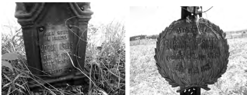
Фото 15, 16. Німецькомовні написи на поховальних пам'ятках австрійських колоністів XIX – початку XX ст. у с. Нагірне Сколівського р-ну

Найбільшими німецькими колоніями у Стрийському повіті, що тоді включав сучасний Сколівський район, станом на 1.1.1939 р. були: Бригідин (суч. с. Ланівка, Стрийський р-н), де проживало 935 німецькомовних осіб, Феліціенталь (с. Нагірне, Сколівський р-н) – 680, Аннаберг (зараз входить у склад с. Нагірне) – 250, Пехерсдорф (хут. Смоляний Стрийського р-ну) – 230, Сколе – майже 400, Грабовець – 350, Гельзендорф (?) – 380, Карлсдорф (?) – 325 і т.д.