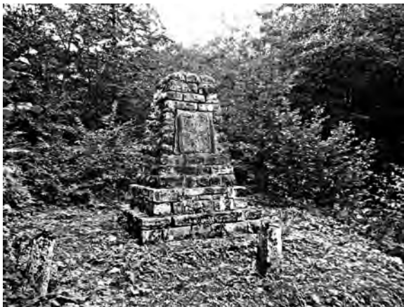
Фото 5. Символічний пам'ятний знак на місці загибелі Кованди – скарбника австрійського барона Гределя

Зараз поховальна пам'ятка набула важливого туристичного значення, що може бути добрим прикладом для використання курганних захоронень для потреб туристичної галузі. Часто на автомобільній дорозі поблизу пам'ятного знака зупиняються туристичні автобуси з іноземними та вітчизняними туристами, які своєю допитливістю прагнуть почерпнути історичні відомості, побачити легендарне місце загибелі князя.