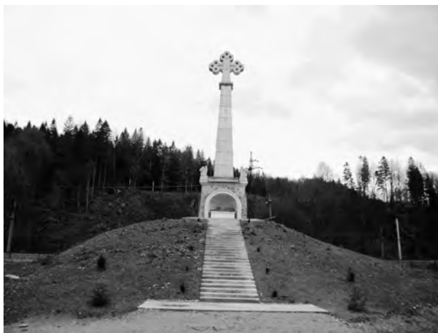
Фото 1. Пам'ятний знак “Могила Святослава” поблизу карпатського містечка Сколе

Цінними для туристичної галузі є поховальні пам'ятки писемного періоду нашої історії, який розпочинається з княжих часів. Давно зауважено, що персоніфіковані поховання відомих осіб та діячів значно більше привертають увагу мандрівників та туристів, ніж звичайні захоронення.