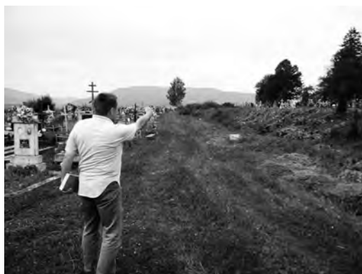
Фото 9. Знівельовані оборонні укріплення на Золотій Горі у Верхньому Синьовидному Сколівського р-ну

Можна легко зауважити, що додатковим пишним оздобленням окремих поховальних плит є майстерно вирізьблені царські корони, семисвічники, лампадки та вази вишуканих форм, казкові квіти, багатий орнамент у вигляді меандру, приручені дикі звірі й птахи, плазуни тощо (фото 8).