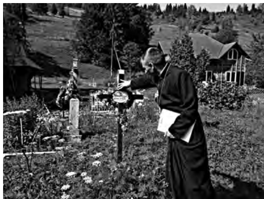
Фото 19. Німецькомовний напис на похованні австрійського воїна у с. Ялинкувате Сколівського р-ну