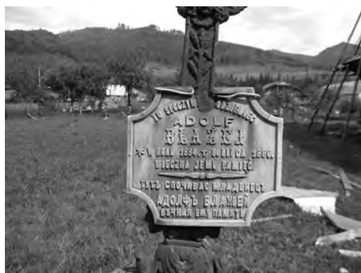
Фото 17. Польсько-український поминальний напис на дитячому похованні XIX ст. у с. Гребенів Сколівського р-ну

Домінування польської мови свідчить про привілейоване становище поляків у тогочасному суспільстві. Іноді на поховальних табличках написи містять унікальну історичну інформацію. Наприклад, великим