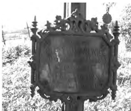
Фото 18. Польськомовний напис на похованні початку XX ст. у с. Гребенів Сколівського р-ну