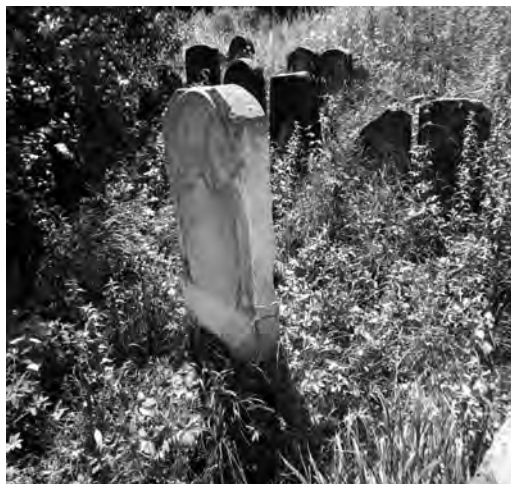
Фото 8. Надмогильні плити на відновленому єврейському кладовищі поблизу Старого Самбора на Львівщині

магнат, власник навколишніх лісів, численних тартаків, земельних угідь – австрійський барон Гредель.