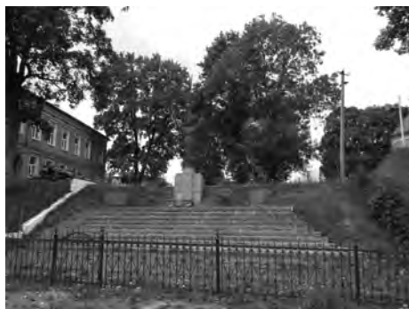
Фото 22. Меморіальний комплекс у Верхньому Синьовидному з скульптурним зображенням матері-України

Варто відмітити й те, що з часу загибелі австрійського армієця пройшло майже сто років, але важливо підкреслити, що, незважаючи на це, місцеві мешканці й досі опікуються могилою чужинця і на даний час вона є доволі доглянутою.