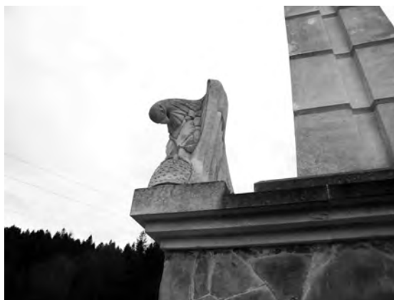
Фото 3. Скульптурне зображення скорботного сокола на верхній кутовій частині усипальні князя Святослава

У її верхніх чотирьох кутових частинах княжої усипальниці знаходяться по одному соколу, які сидять на давньоруських шоломах-шишаках. Відомо, що часто княжа верхівка часто використовувала соколів у мисливських заняттях. Майстерно вирізьблений скорботний вигляд птахів ніби наголошує на незвичайному випадку, який їх зупинив у стрімкому пташиному пориві. І в той же час