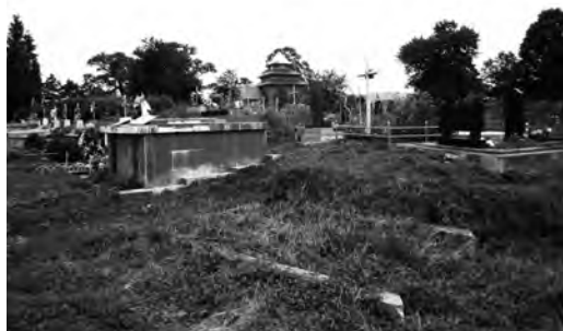
Фото 13. Сучасні поховання на оборонному валі монастиря та церква на Золотій Горі у Верхньому Синьовидному

В переважній більшості своєї протяжності насипний вал є прямим (фото 9), а на кутових частинах має плавне заокруглення (фото 10). Лише у місцях виходу до крутосхилу насип набуває характерного пристосування до рельєфу.