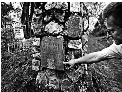
Фото 14. Польське захоронення XIX ст. у Верхньому Синьовидному на Сколівщині

Багато чужоземних поховань сконцентровано у глибинних районах Карпат. В гірських українських селах виявлено значне число захоронень австрійських переселенців. Зауважено, що в окремих випадках ще й досі характерно відмежовані окраїни сіл носять колишні німецькі назви. Наприклад, Айнсдорф (перше село), Карлсдорф (Карлове село), Ернсдорф, Рефельд, Мільбах і т.д. Саме тут провідну роль повинні відіграти результати досліджень стародавніх та сучасних топонімічних назв, як однієї із групи джерел, що в даному випадку має особливе значення для виконання науково-дослідної роботи над історією краю.