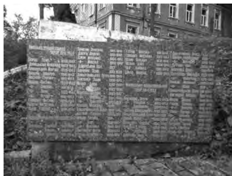
Фото 23. Плита з поминальним написом меморіального комплексу у Верхньому Синьовидному