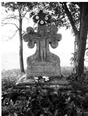
Фото 24. Кам'яний хрест з невідомим написом біля с. Дем'я Миколаївського р-ну Львівської обл.