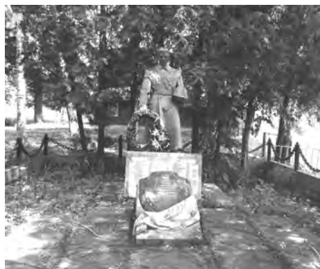
Фото 27. Пам'ятник загиблим воїнам Червоної армії в с. Топільниця Сколівського р-ну

1941, 1944–1991). Зокрема, не знаходить оправдання в оцінці місцевих мешканців потреба руйнування могили австрійських вояків – жертв Першої світової війни, яка знаходилася біля будівлі нової церкви в с. Волосянка, що на Сколівщині, чи десятки інших зруйнованих могил чужинців у багатьох населених пунктах Карпат та Прикарпаття.