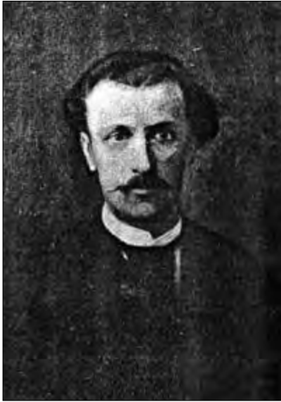
Михайло Жученко. Львів, 1898 р.

Услід за портретами засновників НТШ 1 липня 1898 р. І. Трушеві замовили портрет І. Котляревського 8 . Ним прикрасили залу, де 1 листопада проходила наукова академія з нагоди 100-літнього ювілею виходу „Енеїди“ 9 . У переддень цього свята, 30 жовтня, відбулись вечорниці, присвячені 25-літ-