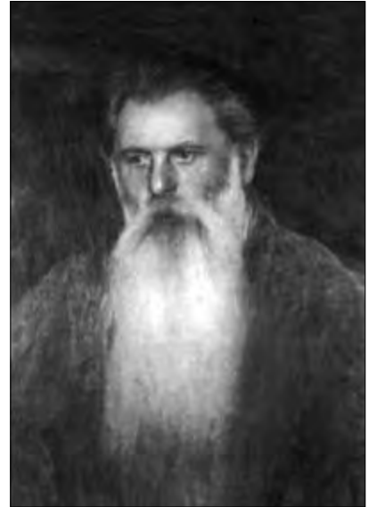
Павло Житецький. Київ, 1900 р.

і се заким мені тут протерли вікна на суфіті і т. п. переніся я до Житецького, котрого я мучив 6 днів з найбільшою відразою і знеохоченням малювати портрети. Я просто постановив радше не малювати портретів ніколи як мучиться і денервувати-ся по приватних домах 19 .