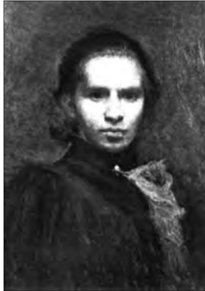
Леся Українка. Львів, 1901–1903 рр. Авторська копія