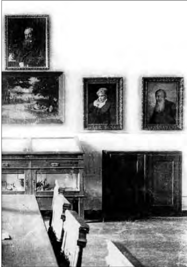
Зала засідань НТШ. Львів, [1912 р.]

Ясновельможному, а чому Вашим приятелем було „неприємно і встидно“ слухати того, що я здивувалась, не побачивши мого портрета в Тов[аристві] [закреслено: за 1 1/2 року ніяк не може дістатись, у Ясновельм. е, а в Тов. ні, хоч замовив його в Києві не Пін[інському], а Тов[ариству]. Я мала право з того дивуватись, бо Ви мені не сказали, що продали оригінал, а не копію, і я була певна, що я принаймні не тільки для самого Пін[інського] позувала, наражаючи своє здоров'я” 28 . У відповідь Труш підтверджує цю інформацію та обіцяє: „Відповідно до гадок ваших, висловлених перед півроком в канцелярії Наук[ового] тов[ариства] ім. Шевченка, Ваш портрет верне незадовго від намісника на своє давніше місце. Підкінчений дуплікат тепер у мене, буде спалений” 29 . І хоча Леся Українка була певна, що оригінал її портрета повернено від Пінінського до галереї НТШ 30 , насправді ж він так і залишився в колекції намісника, звідки пізніше надійшов до Львівської картинної галереї (нині — Львівської галереї мистецтв) 31 . Залу Наукового товариства ім. Шевченка прикрасила авторська копія (певно, та сама, яку художник під впливом емоцій збирався знищити).