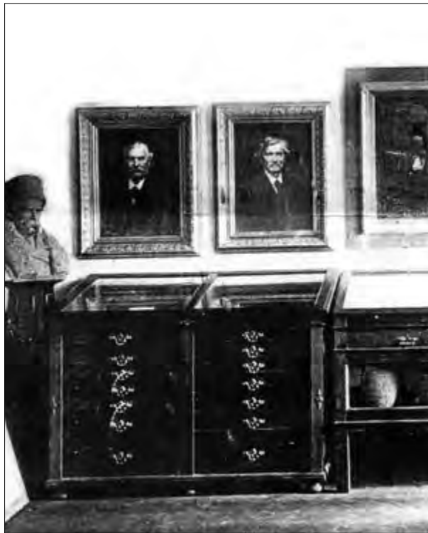
Зала засідань НТШ. Львів, [1912 р.]