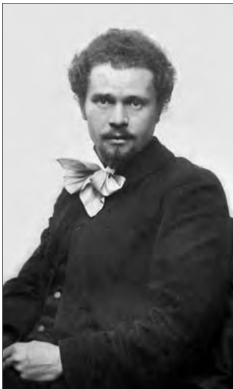
Іван Труш. Київ, 1900 р.

ства, що в кінці і без субвенції вважаю за свій обов’язок“ 3 . Портрети фундаторів НТШ Труш виконував з фотографій 4 . Відомо, що принаймні один із цих фотопортретів, — а саме Єлизавети Милорадович, до НТШ ще 1891 р. надіслав Олександр Кониський 5 . Працюючи над замовленням, І. Труш листовно звертався за консультаціями саме до нього, як до людини знайомої з портретованими, аби передати не лише зовнішню подібність, але й риси їхньої вдачі. Про це О. Кониський згадує у листі до М. Грушевського на початку серпня 1898 р.: „Зараз дістав: 1) Письмо з Косова від того маляра, якому казало Т[оварист]во зробити портрети Мил[орадовички], Жуч[енка] і Пильч[икова]. Він просить деяких звісток, але не подає своєї адреси і підписався так, що можна гадати: Трум, Труш, Трунь. Як йому адресувати?“ 6 У цьому ж листі Кониський, певно, образившись, що не потрапив до числа фундаторів, яких Товариство вирішило вшанувати замовленими портретами, обурюється: „Я, здається, в грудні [18]96 р. писав до Вас, що ініціатором Т[оварист]ва і першим фундатором був я [...] На жаль сей лист не був прочитаний ні на Виділі, ні на зборах, одначе мені писали, що дехто на виділі, довідавшись про сей лист, висловлював такі думки: