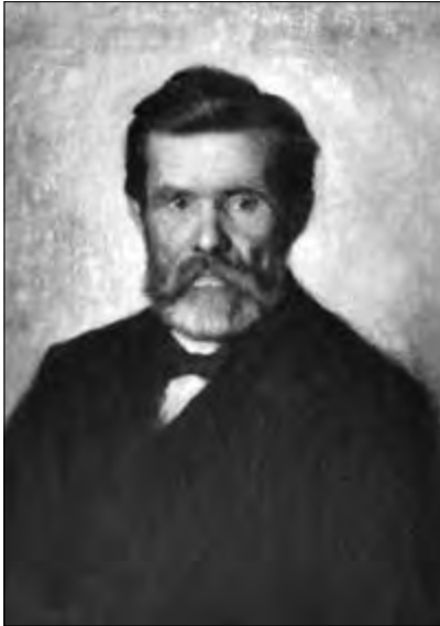
Іван Нечуй-Левицький. Київ, 1900 р.

Павло Житецький імпонував високим ростом, довгою сивою бородою і гарним якби одухотвореним лицем [...] Убрався не ліпше як Антонович, а гірше. Перший раз застав я покійного в довгим перським халаті, затовщеним і витертим із старости [...] Як критик життя і людей, був Житецький білим круком серед цілої російської і австрійсько-української громади — признавав другим талант і заслуги, а навіть любив заслужених вихвалювати і то не короткими словами, а просто довго розво-