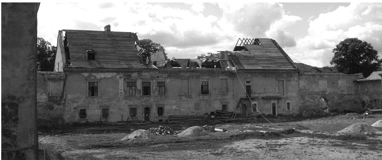
Рис. 4. Реставрація замкового палацу та внутрішнього подвір'я, 2009 р.