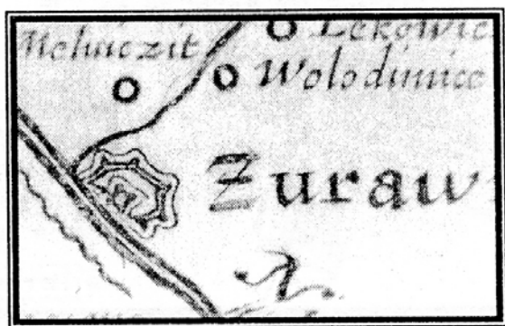
Рис. 1. Журавно. Фрагмент Генеральної карти України Боплана, 1648 р.

Прикладом історичних об'єктів нерухомої культурної спадщини, про які ми знаємо лише за архівними й археологічними матеріалами, є фортифікаційні споруди смт. Журавно (Zurawno),