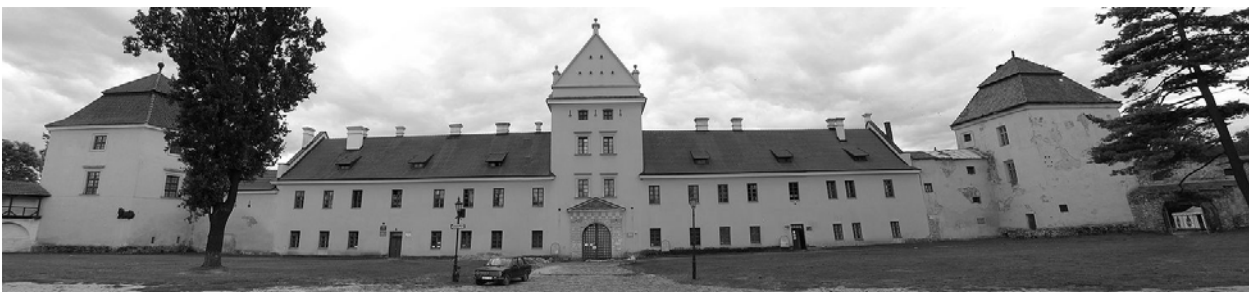
Рис. 5. Панорамний вигляд фронтального крила Жовківського замку, 2009 р.

Досліджені замкові та палацові комплекси зі сформованим історико-архітектурним середовищем, цікавою історією можливо використовувати для проведення громадських заходів і видовищ. Проте в наш час у таких комплексах не має жодного відкритого простору, стаціонарно пристосованого до театралізованої дії історико-музичного фестивалю. Фестивалі розраховані саме на