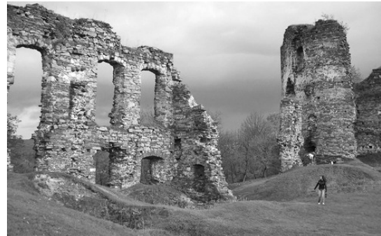
Рис. 2. План замку в Бучачі (за Гуерквіном), [3 с. 92]. Рис. 3. Руїни замку в Бучачі, фото 2010 р.