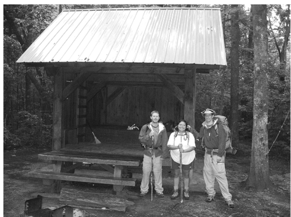
Рис. 9, 10. Туристичний притулок типу «захисток»

Визначивши поняття різних типів гірських туристичних притулків і виявивши ознаки кожного з них, спробуємо класифікувати ці будівлі за допомогою схеми: