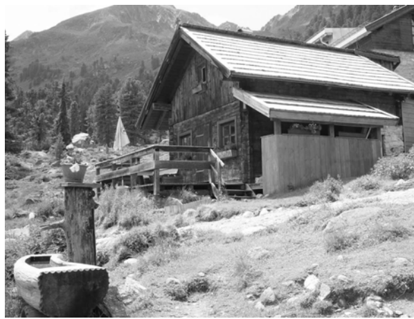
Рис. 3, 4. Туристичний притулок, Тіроль, Австрія.

2. Тип « бівак-коробка » – одноповерхова, однокімнатна будівля у вигляді призматичної коробки, контейнера, вміщає до 10 осіб, без будь-якого інженерного обладнання. Призначена для захисту від негоди та ночівлі, за умови наявності в мандрівника відповідного спорядження. Розміщається здебільшого на високогір'ї, переважно ця будівля є заводського виготовлення і доставлена на місце вертольотом (рис. 5, 6).