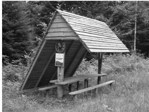
Рис. 7, 8. Туристичний притулок у Національному природному парку «Сколівські Бескиди» Сколівського р-ну Львівської обл.