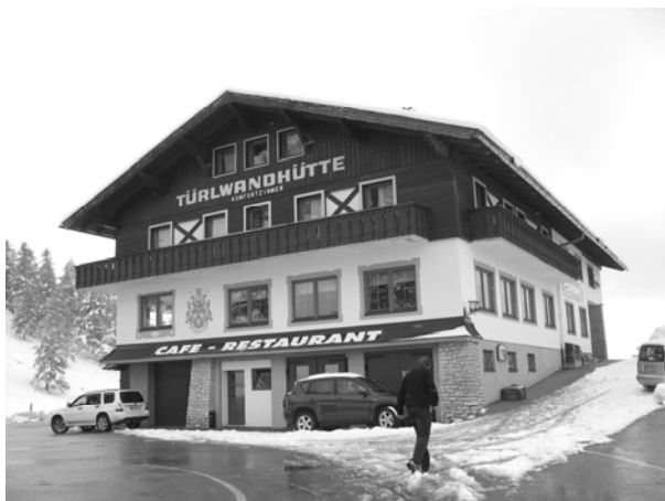
Рис. 1. Туристичний притулок «Тюрльвандгютте», Штаермарк, Австрія.

а) притулки з обслуговуванням – можуть вміщати до 200 осіб, обладнані всіма інженерними комунікаціями. Спальні приміщення – це як загальні кімнати, так і дво-, чотиримісні комфортні номери. Будівлі обладнані санвузлами та душовими, їдальнею, кухнею, приміщеннями для сушіння та зберігання туристичного спорядження. У таких притулках є обслуговувальний персонал, який тут же і проживає. Ці заклади здебільшого сезонної дії, взимку вони є зачиненими, але деякі з них обладнані т.зв. «зимовими приміщеннями», які є доступними в несезонний час. Розміщуються такі притулки переважно в районах наймасовіших сходжень, буває можливість автомобільного, а інколи і залізничного доступу, декотрі з комфортабельних притулків, як уже зазначалось, мають статус гірського пансіонату (рис. 1, 2);