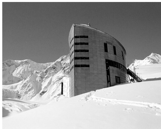
Рис. 2. Туристичний притулок біля г. Мон Велан, Швейцарія.

б) притулки без обслуговування – вміщують до 50 осіб, складаються з загальних спальних кімнат, можуть бути окремі приміщення для сушіння спорядження, а також для приготування їжі, туалет на дворі, опалення переважно пічне. Такі притулки розміщують високо в горах, до них є лише піший доступ (рис. 3, 4).