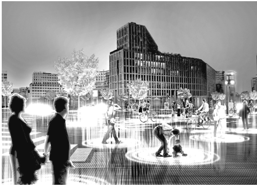
Рис. 2. Футуристичний проект центру Берліна, проект групи BIG