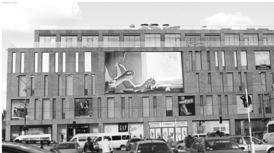
Рис. 3. Фасад торговельного центру «Пасаж» у Дніпропетровську, арх. О. Дольнік

Наведений аналіз цих трьох досить різних і за функцією, і за об'ємно-просторовим вирішенням прикладів дає можливість говорити про універсальність як емоційно-респонсивної, так і особистісно-антропоцентричної трансформації в сучасній архітектурі. Загальна спорідненість цих аспектів в різноманітних проявах сучасної архітектури говорить про її фундаментальну важливість як у її створення, так і у її випереджувальному розумінні на рівні архітектурної теорії. В цьому контексті окремим, цілковито не вивченим пластом знань, є різні архітектурні прояви мінливо персоналістичної природи сучасної особистості на рівні нетехнологізованих та периферійних середовищ, де штучні інструменти-посередники не можна організувати за допомогою високотехнологічних медіа.