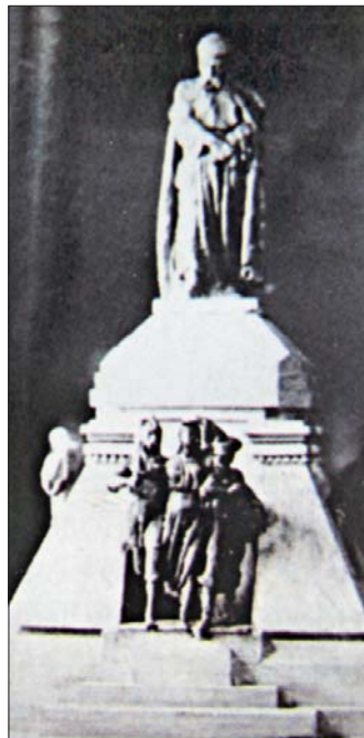
Михайло Гаврилко. Проєкти пам'ятника Т. Шевченкові в Києві. 1909—1914 рр.