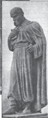
Михайло Гаврилко. „Козак і дівчина“, „Тарас Шевченко“. Сцени з проєкту пам'ятника Т. Шевченкові в Києві