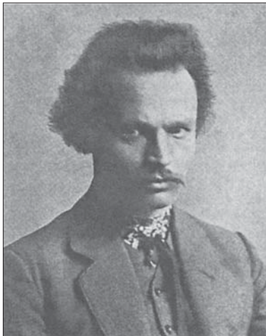
Михайло Гаврилко (1882—1920)

Народився Михайло Гаврилко в козацьких хуторах поблизу с. Руківщини на Полтавщині 1882 р., у краю, який так щедро обдарував нашу українську культуру талановитими людьми. Ця чарівна земля на все життя прищепила йому любов до прекрасного, розуміння найтонших порухів мікро- і макрокосмосу, природи, навчила бачити красу у, здавалося б, буденних явищах — квітці, дереві, лісові, грозі. Дивну рису його характеру не раз відзначали друзі й знайомі Михайла.