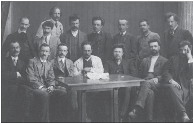
Редакція газети „Рада“.

під забудову, підпорядкування гуртожитку, механізму керування ним. Із „Заяв до народного комітету у Львові про необхідність будівництва та утвердження права власності на ґрунт для будови Академічного дому для Наукового товариства ім. Шевченка у Львові“ 10 стає відомо, що ґрунт під Академічний дім, закуплений наприкінці 1903 р. (800 сажнів за 26359,76 кор.), взяло у свою власність НТШ. У виборі земельної ділянки активну участь брав і Є. Чикаленко. Будинок гуртожитку зведено наприкінці 1906 р. на розі вулиць Супінського та Мохнацького (нині — вул. Коцюбинського, 21). До 1912 р. у ньому, крім гуртожитку, містилися