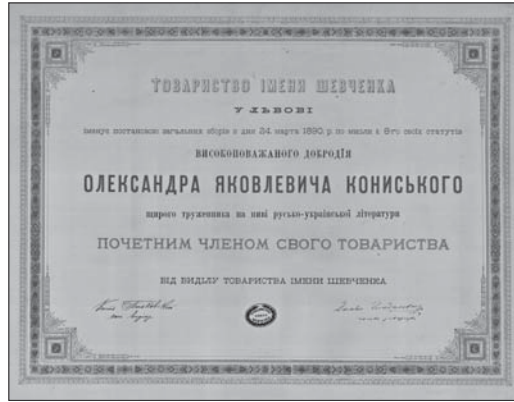
Грамота почесного члена Товариства ім. Шевченка Олександра Кониського. 1890 р.

Як було реалізовано цю волю, реконструкція книжкового зібрання О. Кониського в Бібліотеці НТШ — тема окремого дослідження, джерелом якого можуть слугувати його власноручний каталог, інвентарні книги бібліотеки та інші документи книгозбірні з фонду НТШ. А в „Справозданні з бібліотеки за час від 1 вересня до 31 грудня 1908 р.“ серед нових надходжень зафіксовано 67 томів та 8 карт кінця XVIII — початку XIX ст. з бібліотеки О. Кониського та докладно розписано його архівні збірки, якими поповнився рукописний відділ бібліотеки: листування, томи з автографами українських письменників та етнографічними записами, матеріали до біографії Т. Шевченка, рукописи вченого тощо 54 . При порівнянні опису фонду О. Я. Кониського (№ 77), що нині зберігається у Відділі рукописних фондів та текстології Інституту літератури ім. Т. Г. Шевченка НАН України 55 , з цим звітом Бібліотеки НТШ, впадає в око, що ці два документи дублюють один одного. Мовчаз-