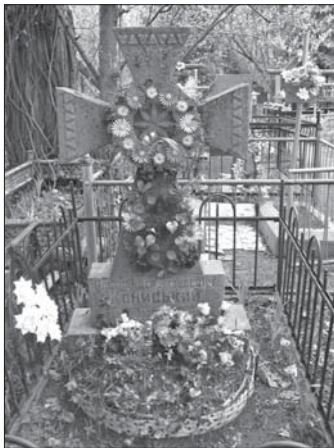
Могила О. Кониського на Байківському кладовищі у Києві