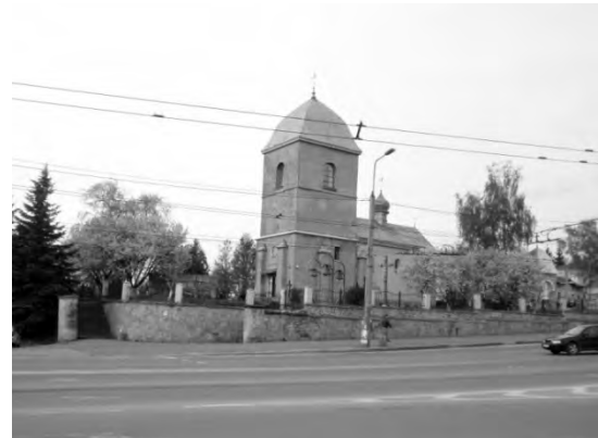
Рис. 6. Церква Воздвиження Чесного Хреста. Сучасний вигляд