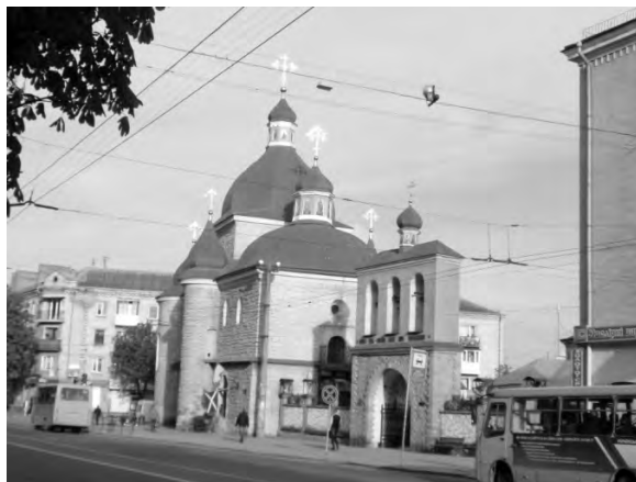
Рис. 13. Церква Різдва Христового. Сучасний стан