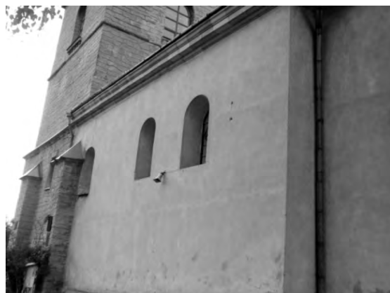
Рис. 10. Віконні прорізи церкви Воздвиження Чесного Хреста