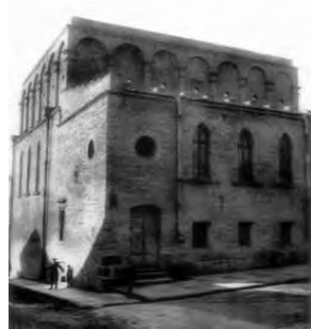
Рис. 16. Стара синагога на світлині з поч. XX ст.