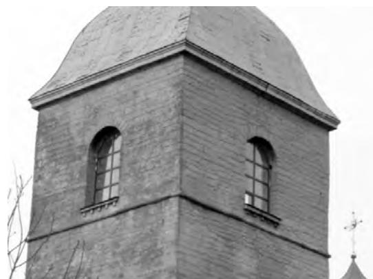
Рис. 8. Вікна дзвінниці церкви Воздвиження Чесного Хреста