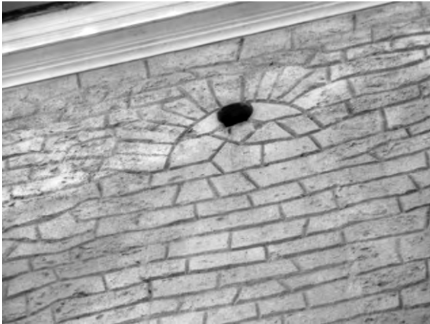
Рис. 15. Кругла бійниця в північному фасаді церкви Різдва Христового

забувається, зникають її останні свідки. На даний час мало кому відомо, який вигляд мало місто в 16 ст., де були його межі, які споруди були його основою. Місто зазнало значних руйнувань під час I та II світових воєн. В ході відбудови міста в повоєнний період «стерлось» його первісне розпланування. Великою втратою для міста стало знищення старої синагоги під час німецької окупації (її рештки були розібрані в ході відбудови міста). Збереглося багато іконографічних матеріалів, за якими можна практично до деталей відновити цю споруду, про існування якої знають лише старожили Тернополя. Проведення археологічних розкопок могли б дати інформацію про локалізацію в'їзних брам, Шевської і Кушнірської вежі, західного надставного муру. Щонайменше, встановлення пам'ятних знаків дало б змогу жителям Тернополя краще орієнтуватись в багатій історії міста.