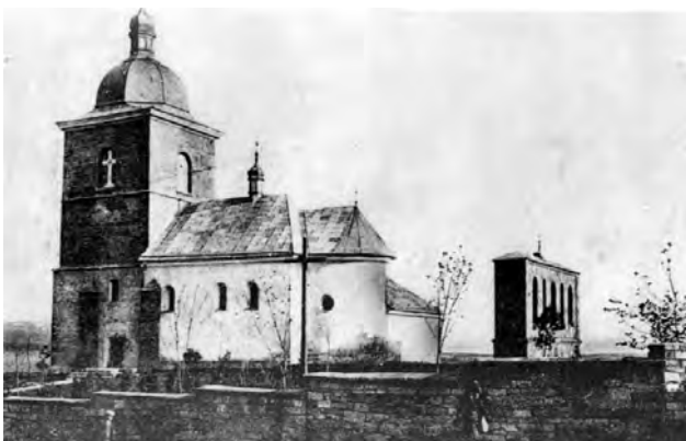
Рис. 5. Церква Воздвиження Чесного Хреста на світлині з поч. XX ст.