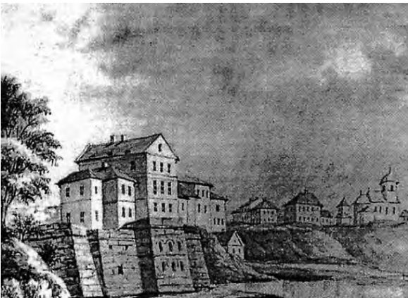
Рис. 3. Тернопільський замок на літографії Наполеона Орди. 1870-ті рр.

Відомо, що в міських укріпленнях були дві оборонні вежі: Шевська і Кушнірська (назви пов'язані зі спеціалізацією цехів, яким вони належали) [4]. На теоретичній реконструкції Рачинського нанесене місце розташування однієї з веж. Відомо, що Кушнірська вежа знаходилась над ставом, неподалік від Воздвиженської церкви, а Шевська на краю заплавлених лугов, в районі сучасного парку ім.Т. Шевченка [4]. Однак ці свідчення є неоднозначні.