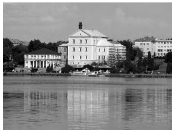
Рис. 4. Тернопільський замок. Сучасний стан