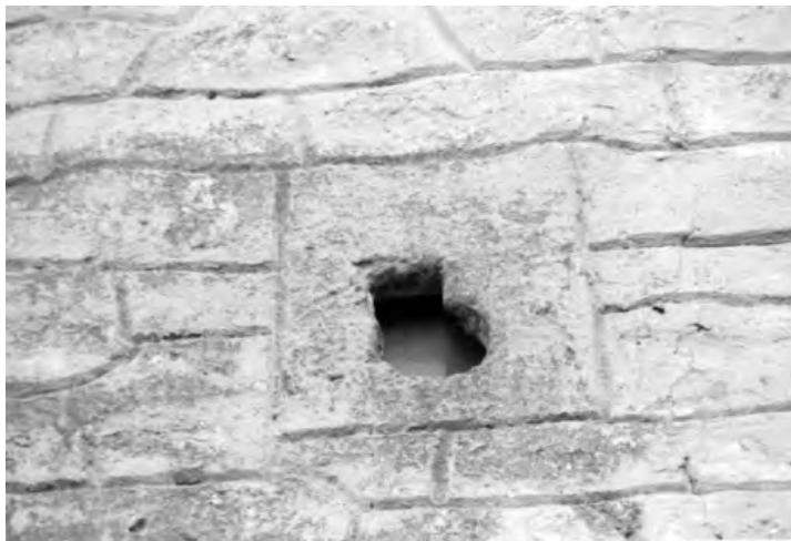
Рис.11. Бійниця у вигляді перевернутої замкової щілини церкви Воздвиження Чесного Хреста