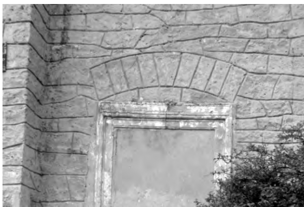
Рис. 9. Розвантажувальна арка над замуруваним порталом в стіні півд. фасаду церкви Воздвиження Чесного Хреста

могла охороняти вхід до храму (Рис. 11). Зі старих світлин та акварелей можна судити про зміни форми покрівлі башти храму та замурування дверей південного фасаду (Рис. 9).