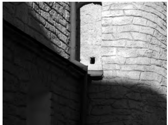
Рис.14. Бійниця в башті церкви Різдва Христового