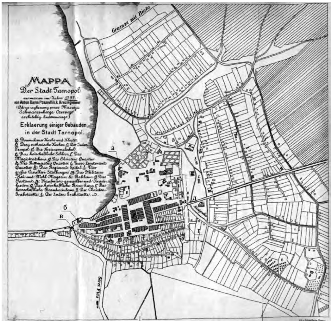
Рис. 1. Найдавніша картографічна пам'ятка Тернополя – план Посареллі 1797р.: а) Замок; б) Церква Воздвиження Чесного Хреста (Надставна); в) імовірне місцезнаходження Львівської брами; г) імовірне трасування земляного валу, що був розібраний до 1797р.; д) церква Різдва Христового (Середня); е) синагога