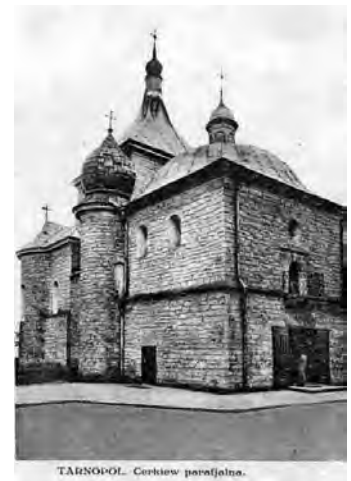
Рис. 12. Церква Різдва Христового на поштової листівці з поч. XX ст.