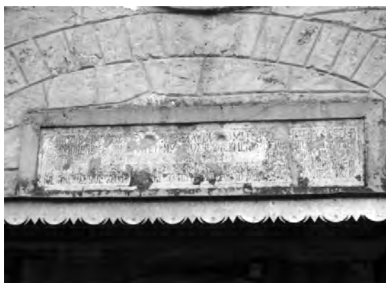
Рис. 7. Фундаційний камінь церкви Воздвиження Чесного Хреста

Над Львівською брамою височіла церква Воздвиження Чесного Хреста (Воздвиженська) або ж Надставна (Рис. 5, 6). Безпосередня близькість храму до воріт міста, фактично втягувала храм в систему міських укріплень. Перші історичні відомості про церкву містяться у грамоті Костянтина Острозького з 1570 р. Спершу храм був без вежі-дзвінниці, лише в 1627 р. із західного фасаду до церкви добудовують дзвіницю [6]. Церква Воздвиження Чесного Хреста вимурувана з пісковика. В плані це - тридільний храм із прямокутною навою, квадратним рівношироким із навою бабинцем, верхні яруси якого займає вежа, і напівкруглої апсиди. Форма апсиди вказує на використання давньоруських традицій, що вирізняє храм з-поміж інших оборонних сакральних споруд Поділля. У 1627 р. із західного фасаду до церкви добудовують дзвіницю, про що можна дізнатися із надпису на камені над головним порталом [6] (Рис. 7). Воздвиженська церква розміщена на Підзамчу – природному підвищенні над ставом. Завдяки такому положенні церква брала участь у системі сповіщення регіону. За переказами, під час тривоги тут били дзвони, палили смолоскипи, багаття, які було видно аж на Голубіцьких Товтрах і які передавали сигнал далі на інші важливі укріплення регіону. Можливо, саме необхідність сигнального пункту стала причиною добудови триярусної дзвінниці через майже 60 років після заснування церкви. Великі віконні прорізи, влаштовані у всіх чотирьох стінах, у верхньому ярусі дзвінниці, є підтвердженням цього (Рис. 8).