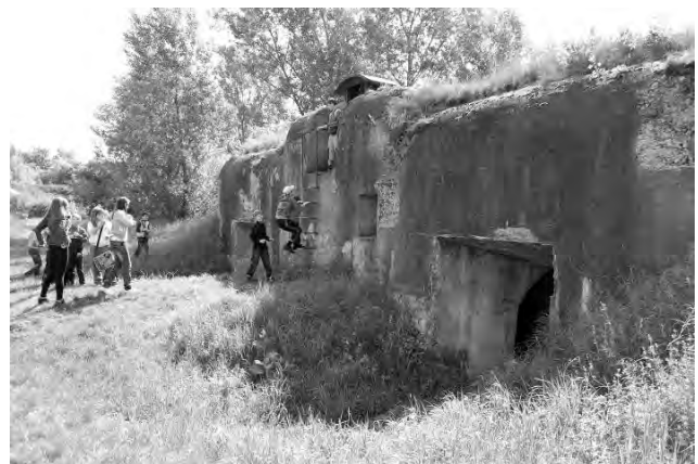
Світлина 19. Екскурсія на форті № 5

Форт № 5 живе, розвивається і працює. Він відкритий для всіх і чекає на своїх відвідувачів.