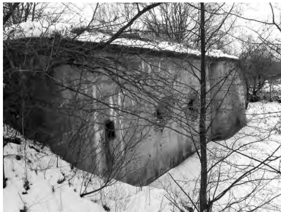
Світлина 10. Правий напівкапонір