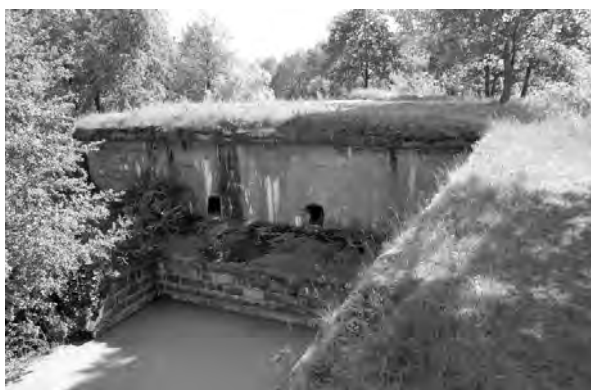
Світлина 11. Передній капонір