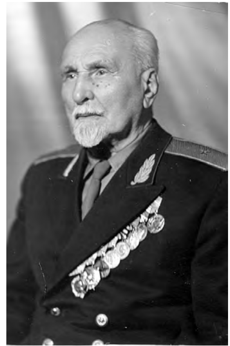
Світлина 4. Белінській І. О., генерал-майор, 1969

Цегляні склепіння і стіни горжевої казарми покривали бетоном і залізобетоном, товщиною понад 2 м. Під головним валом, де збудовані потерни, були ніші для стрільців.