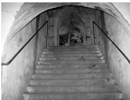
Світлина 18. Сходи на верхній поверх у горжевому капонірі

160 екскурсійних груп і понад 6 тисяч відвідувачів відвідали форт у 2010 р. За 5 місяців цього року відвідуваність зросла на 121 відсоток. Це свідчить про зростаючу популярність 5 форту як туристичного об'єкту.