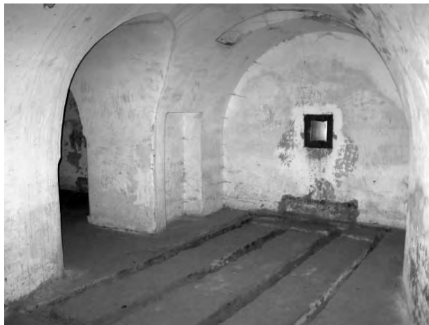
Світлина 16. Артилерійський каземат для 57 мм гармати

У 1995 р. форт №V внесли до списку історико-культурних цінностей Республіки Білорусь. Цій події передувала велика науково-дослідна робота, яку виконали співробітники меморіалу. У квітні 1997 р. на нараді в Брестському облвиконкомі вперше обговорювали питання про підготовку форту №V для екскурсійного обслуговування, тоді ж затвердили перелік заходів з облаштування форту. Територію і будівлі очистили від сміття, встановили