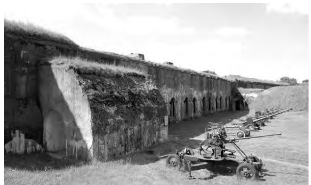
Світлина 6. Вид на казарми горжі