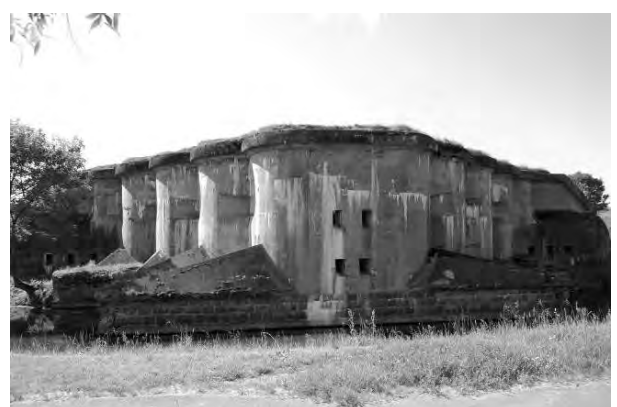
Світлина 8. Горжевий капонір форту № 5