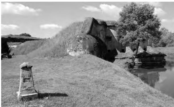
Світлина 5. Горжевий капонір та еспланадний стовп.

Цегляні склепіння і стіни горжевої казарми покривали бетоном і залізобетоном, товщиною понад 2 м. Під головним валом, де збудовані потерни, були ніші для стрільців.