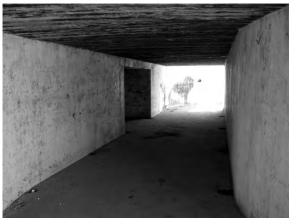
Світлина 14. Казематна траверса, верхній поверх