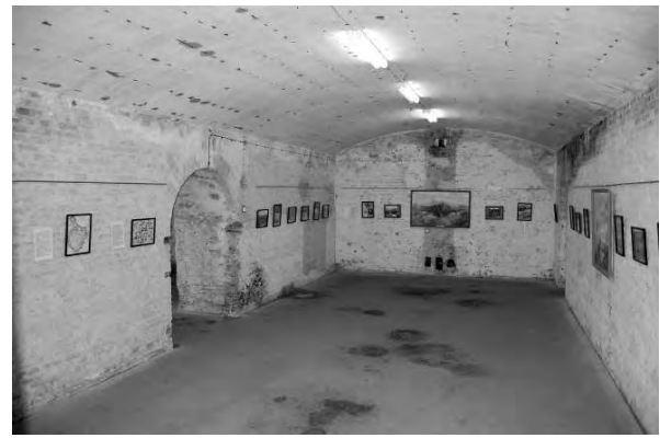
Світлина 17. Експозиції у форті № 5 (Продовження).

Неодноразово на території 5 форту проходили різноманітні заходи: воєнно-патріотична акція «Західний форпост Батьківщини», гра «Зірниця», зльоти страйкбольних клубів, Дні туризму для жителів та гостей м. Брест. Так, у листопаді 2006 року відбулась воєнно-патріотична акція, присвячена 50-річчю Музею оборони Брестської фортеці і 35-річчю меморіального комплексу «Брестська фортеця-герой». Перед глядачами постали воїни різних епох, які захищали Брест від іноземних загарбників.