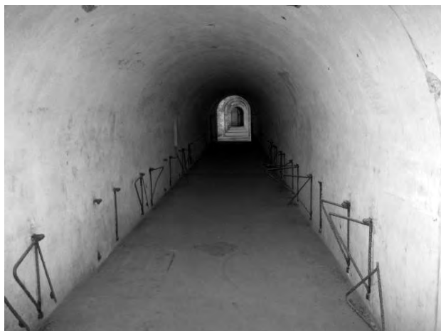
Світлина 15. Потерна з відкідними сидіннями