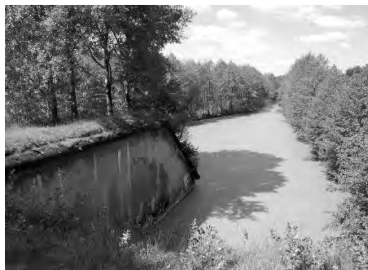
Світлина 12. Передній капонір та обвідний канал