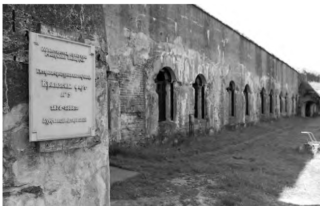
Світлина 7. Охоронна таблиця та казарми.