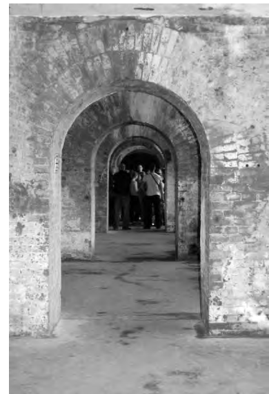
Світлина 17. Експозиції у форті № 5