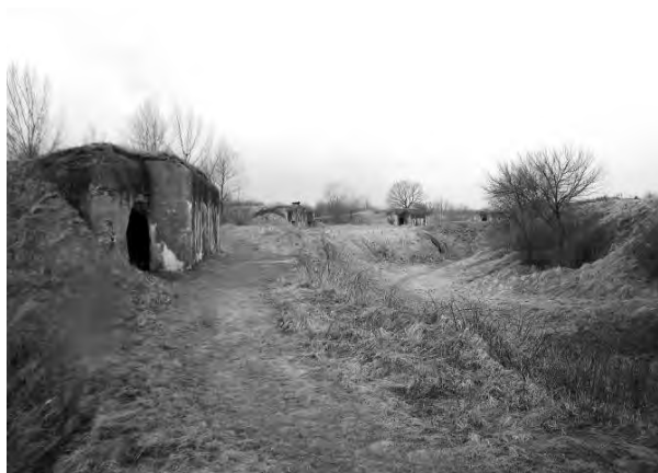
Світлина 9. Казематні траверси форту

У 1911-1914 рр. форт №V знову перебудували. На валу спорудили бетонні сховища – казематні траверси. Позиції для стрільців частково забетоновані. Побудований двоповерховий капонір горжі. Перший поверх капоніра був розрахований на вісім 57-мм. капонірних гармат, які прикривали форт з тилу. Другий поверх, що виконував роль проміжного капоніра, був розрахований на вісім 76-мм гармат, які прострілювали проміжки між фортами IV і V, V і VI, а також місцевість попереду та позаду них.