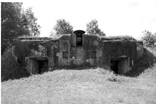
Світлина 13. Центральна казематна траверса зі спостережним пунктом