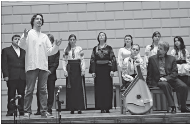
Артисти концерту „Музика до Кобзаря“ — студенти Львівської національної музичної академії ім. М. Лисенка

Аналіз досягнутого дає підстави вважати, що форми наукової праці НТШ — конференції, наукові сесії, „круглі столи“, академії у секціях, комісіях, осередках з подальшим обговоренням і публіка-