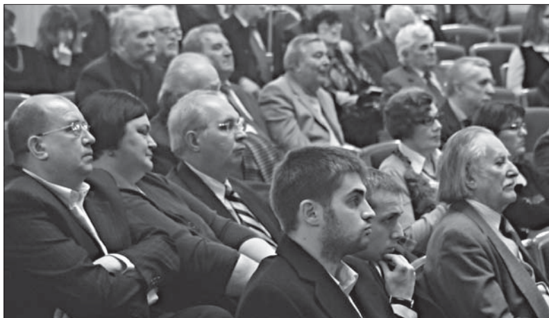
У залі засідань

Заслугує на всіляку підтримку така проблематика, як „Оптимізація структури земельних ресурсів та вплив лісових систем на навколишнє природне середовище“ ( Комісія проблем лісівництва ); „Пам'ятки української писемності“, „Шевченкознавство“ і „Франкознавство“ ( Літературознавча комісія ); „Давньоукраїнська