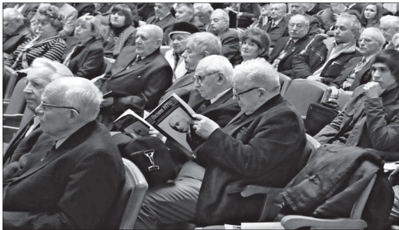
У залі засідань