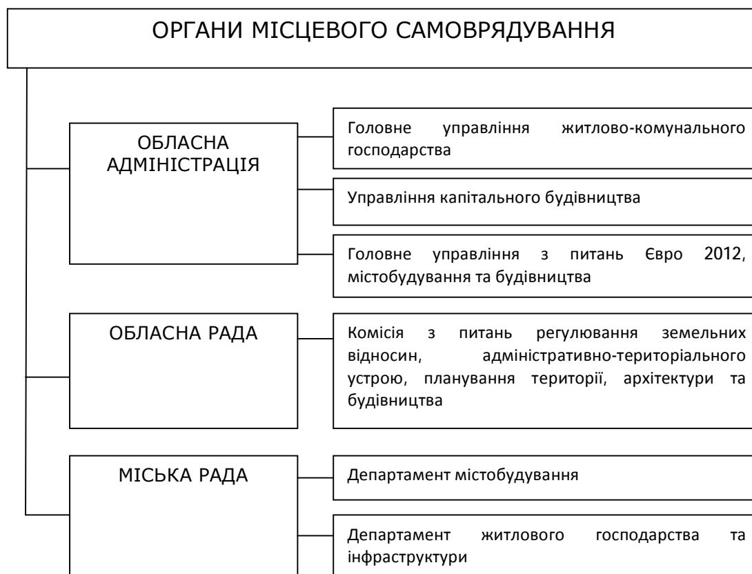
Рис. 3. Органи місцевого самоврядування і їх відділення, в яких займаються питаннями будівельної галузі [9]

До органів місцевого самоврядування належать обласні ради, обласні адміністрації, міські ради. Зобразимо органи місцевого самоврядування для м. Львів (рис. 3).