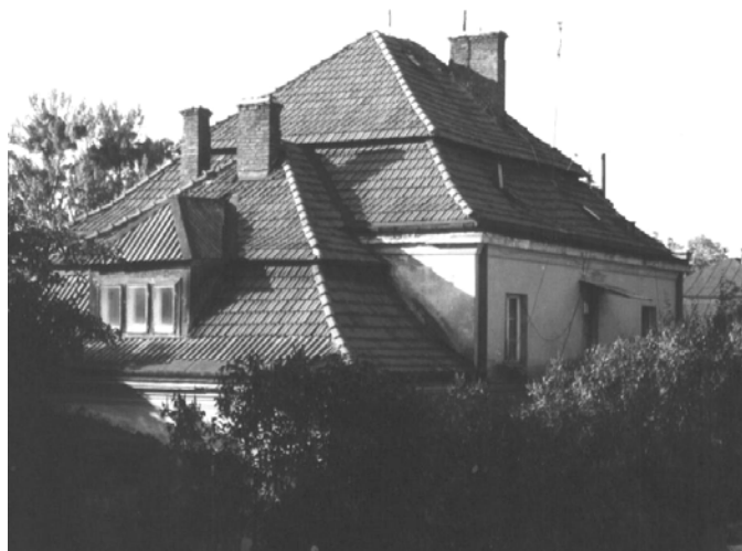
Рис. 1. Фото, які показують характер історично сформованої забудови ділянки