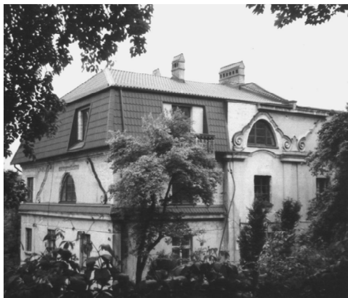
Рис. 2. Фото архітектурно неграмотно перебудованої правої частини історичного будинку