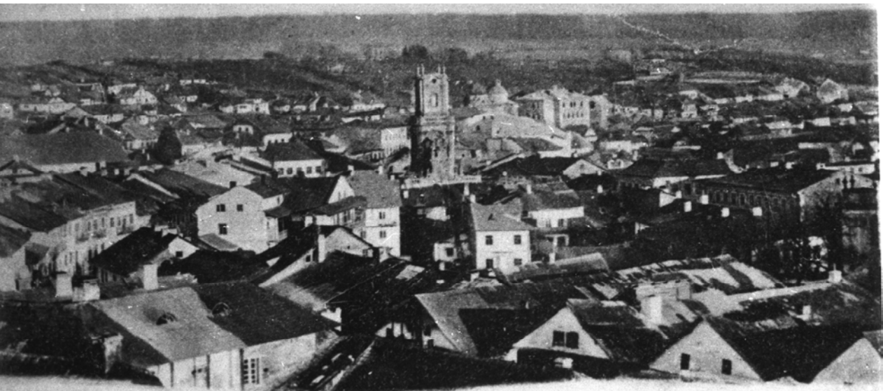
Рис. 3. Ландшафт дахів середмістя Бучача наприкінці XIX ст. [12]. Домінанта – будівля ратуші на щільно забудованій ринковій площі, позаду – купол церкви Св. Покрови. Матеріал дахів на будівлях: гонт, керамічна дахівка та покрівельне залізо, мідні листи