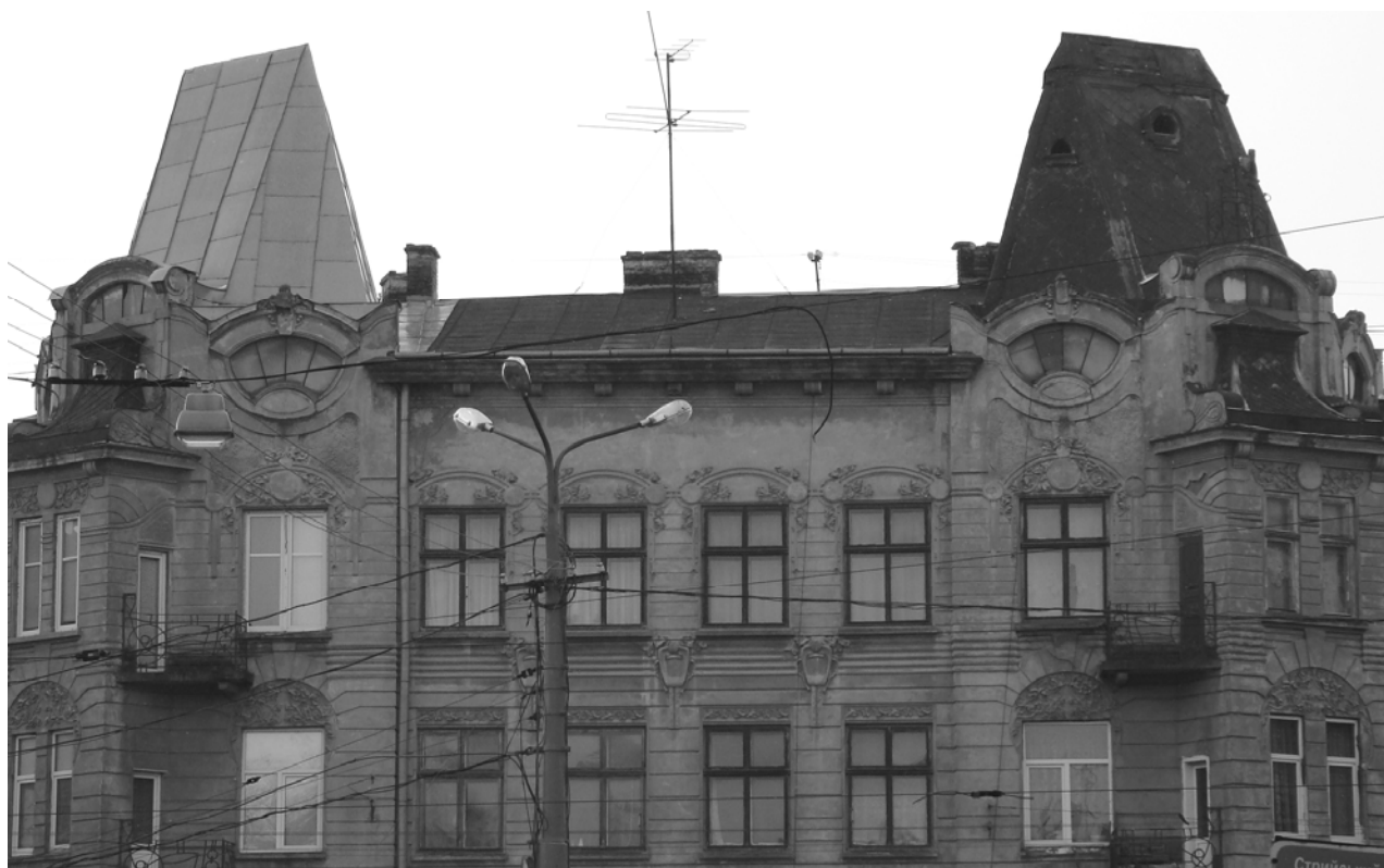
Рис. 9. Приклад нереставраційного ремонту даху будівлі-пам'ятки на розі вул. І. Франка та Стрийської у Львові. Застосовано не властивий для історичної будівлі матеріал, під час заміни покрівлі спрощено відтворено низку деталей і профілювань, частину старого металевого декору втрачено