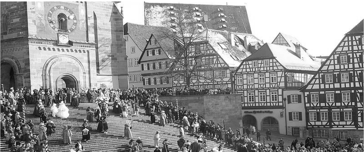
Рис. 6. Реставровані будинки з поверненням первісних форм даху на центральній площі міста Швабіш Галль, Німеччина [14]