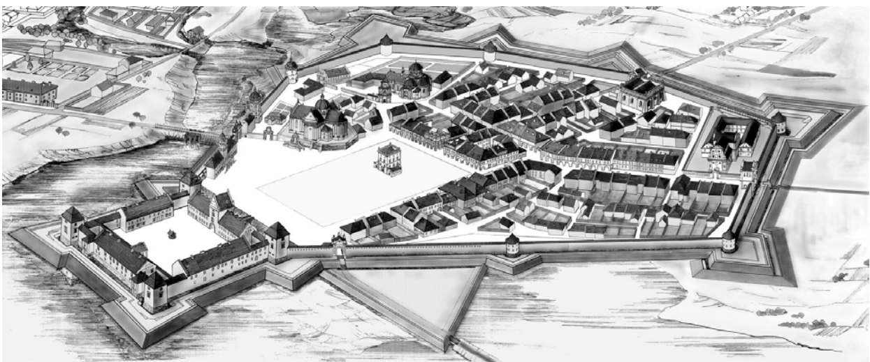
Рис. 7. Графічна реконструкція забудови середмістя Жовкви станом на кін. XVII ст. (виконана авторським колективом: М. Бевз, О. Оконченко, І. Оконченко [13])