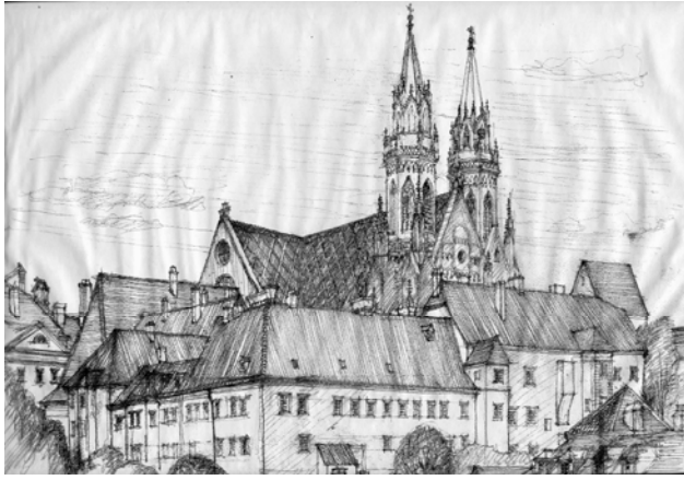
Рис. 4. Спадисті дахи, накриті керамічною дахівкою, в місті Кlostернбуурзі (Австрія)

багатьох інших місцях) або у разі самовільних чи дозволених перебудов історичних будинків (маємо численні приклади таких перебудов, при яких втрачаються вишукані історичні форми дахів та цінні елементи їх декорування: шипці, люкарни, аттики, фронтони (в районі вул. Черешневої, Лісної, Тарнавського та ін.). Агресивні новобудови з'являються в історичному центрі міста Львова й в останні роки – це вже зведена будівля на проспекті Свободи, 45 поряд з оперним театром) та будівництво на площі Міцкевича, 10 та плани будівництва на вул. Валовій, 15.