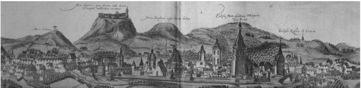
Рис. 2. Вид Львова з заходу на гравюрі Ф. Гогенберга з 1618 р. (О. Чернером [15]). Зображено унікальний силует середмістя та двох передмість. У силуеті домінують брили будівель храмів з дзвіницями, будівля ратуші з вежею, оборонні стіни з вежами та баштами. Дахи житлової забудови щипцеві, двох кольорів (червоного і синього), що може означати наявність двох матеріалів – керамічної дахівки та гонту