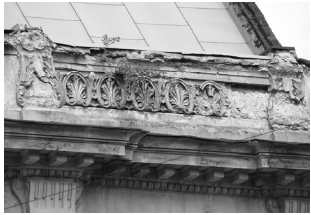
Рис. 5. Приклад нереставраційного ремонту даху будівлі-пам'ятки на вул. Гнатюка у м. Львові. Застосовано невластивий для історичної будівлі матеріал, при заміні покрівлі спрощено відтворено низку деталей і профілювань, частину старого металевого декору втрачено. Приклад некомплексного підходу до проведення робіт на пам'ятці архітектури. Реставраційний ремонт покрівлі мав би супроводжуватися реставрацією карнизів та декоративних парпетів