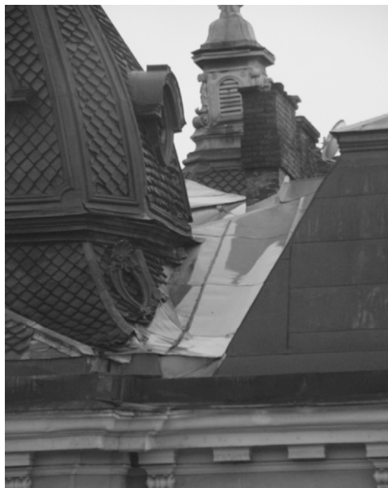
Рис. 8. Добре збережена автентична дерев'яна дахова конструкція колишнього костелу Св. Казимира у Львові (а); Приклад "ремонту" даху на будівлі-пам'ятці на проспекті Т. Шевченка у Львові (б)