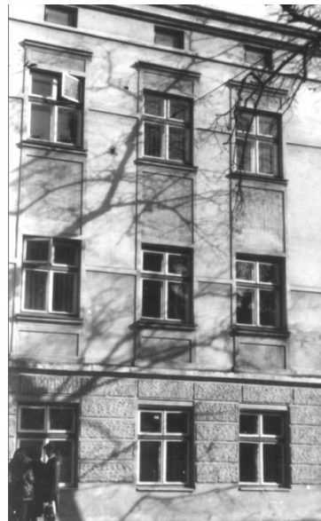
Рис. 15. Лаконічне вирішення антаблемента в пізньому модерні (вул. Пекарська, 41)