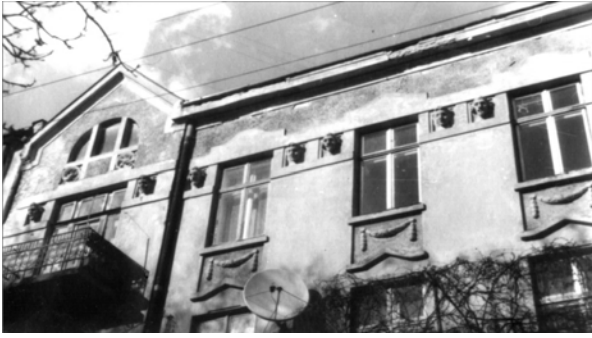
Рис. 1. Суцільне оздоблення площини під карнизом та аттика фактурою “під шубу” (вул. Старицьких, 4)