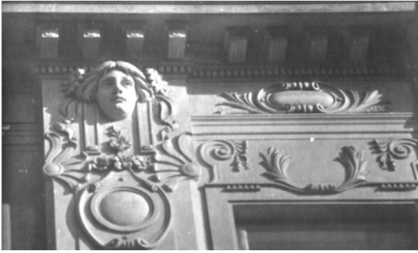
Рис. 17. Стилізація класичних мотивів у вирішенні антаблемента (вул. ген. Чупринки, 28)