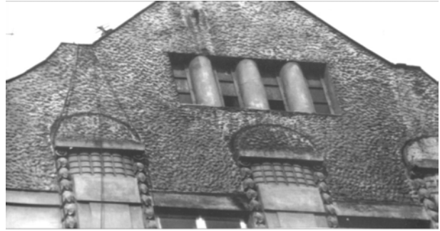
Рис. 2. Суцільне оздоблення аттика фактурою “під пироги” (вул. Франка, 116)