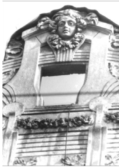
Рис. 12. Оформлення маскаронем замка аттикового віконечка (вул. Шептицьких, 19)