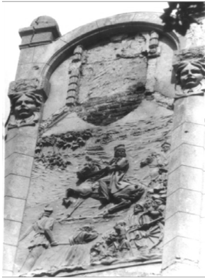
Рис. 11. Оздоблення барельєфом аттика (вул. Горської, 5)