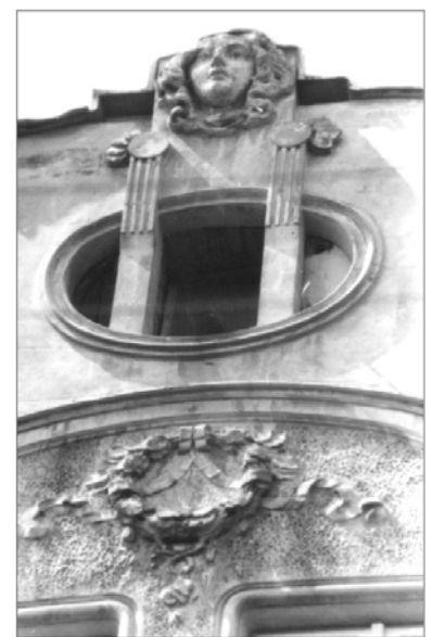
Рис. 16. Єдиний (з чотирьох) збережений маскарон аттика (вул. Глибока, 6/8)