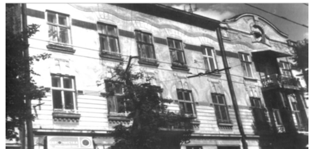
Рис. 6. Декор “хвильок” на фризі кам’яниці (вул. Зелена, 51)