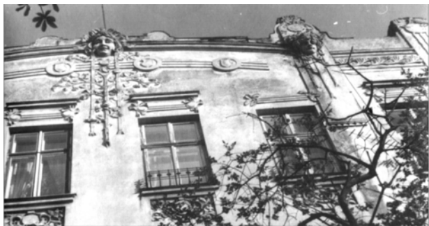
Рис. 7. Оздоблення аттика мотивом “дерева життя” та жіночими маскаронами (вул. Коновальця, 15)