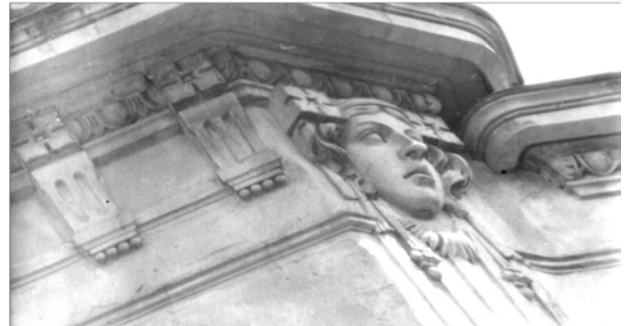
Рис. 22. Поєднання сечійних та класичних мотивів у вирішенні антаблементу (вул. Котляревського, 21)