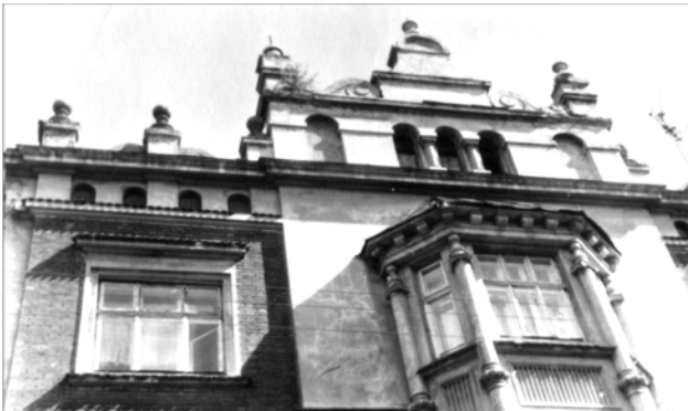
Рис. 19. Неоренесансний аттик з волютами, обелісками та іншими, заповненими фактурою "під шубу" (вул. Тарнавського, 13)