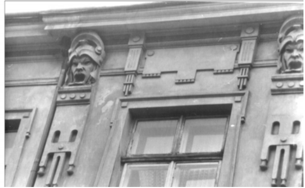
Рис. 18. Оформлення маскаронем кронштейнів карниза (вул. Саксаганського, 14)