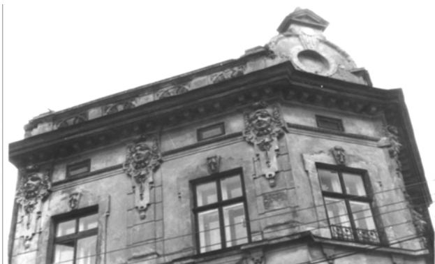
Рис. 23. Вирішення фриза та аттика (вул. Чорноморська, 12)