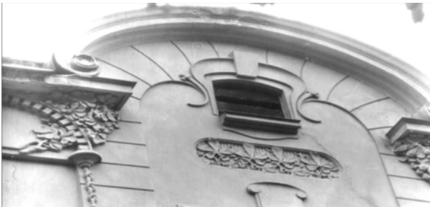
Рис. 5. Оздоблення аттика листям каштану (вул. Франка, 126)