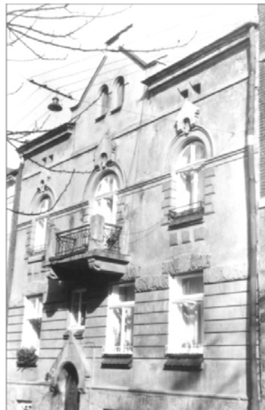
Рис. 14. Стилізація готичного цитиця (вул. Вишенського, 9)