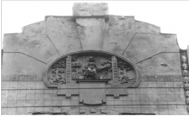
Рис. 9. Барельєф та розрізка "під керамічну плитку" на аттику кам'яниці (вул. Франка, 130)