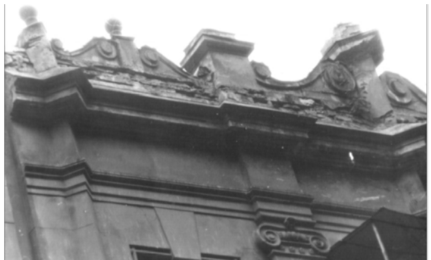
Рис. 24. Руїнування неоренесансного аттика (вул. Франка, 136)