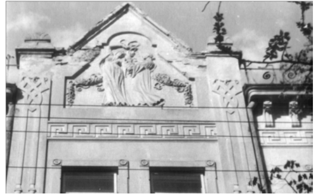
Рис. 10. Оздоблення барельєфом "Благовіщення" фронтону (вул. Глибока, 12)