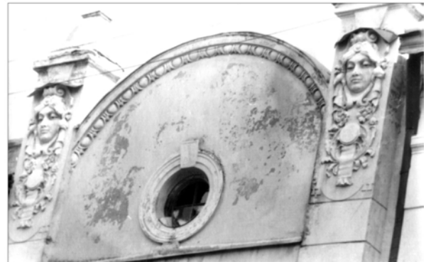
Рис. 20 Півкруглий аттик, фланкується пілонами, увінчаними маскаронами (вул. Антоновича, 19)