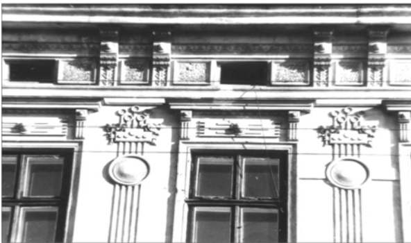
Рис. 3. Поєднання сецесійних та класичних мотивів у вирішенні фриза: оздоблення дзеркал між модульонами фактурою хаотичних штрихів (вул. Зелена, 29)