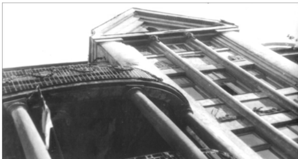
Рис. 21 Трикутний фронтон класицизуючого модерну (вул. ген. Чупринки, 49)