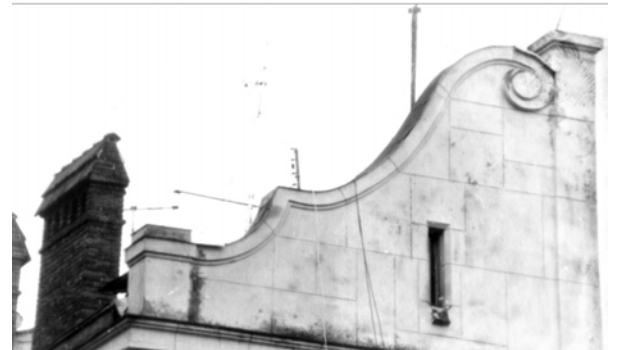
Рис. 4. Розрізка “під орис pseudoisodomum” необарокового фронтона (вул. Франка, 127)