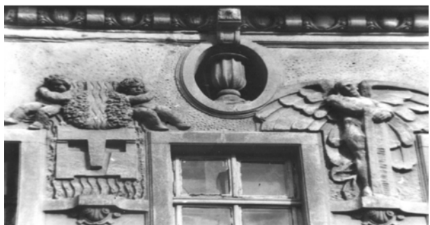
Рис. 8. Оздоблення площини під карнизом баральсфами, розташованими на фактурі “під шубу” (вул. Гоголя, 14)