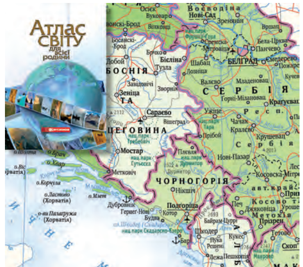
Рис. 4. Атлас світу для всієї родини