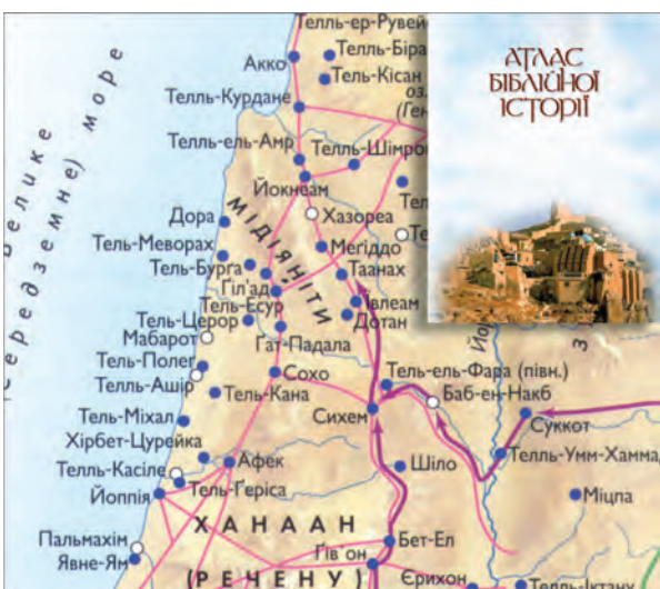
Рис. 5. Атлас Біблійної історії