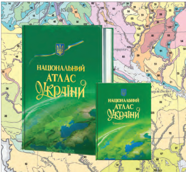
Рис. 1. Національний атлас України