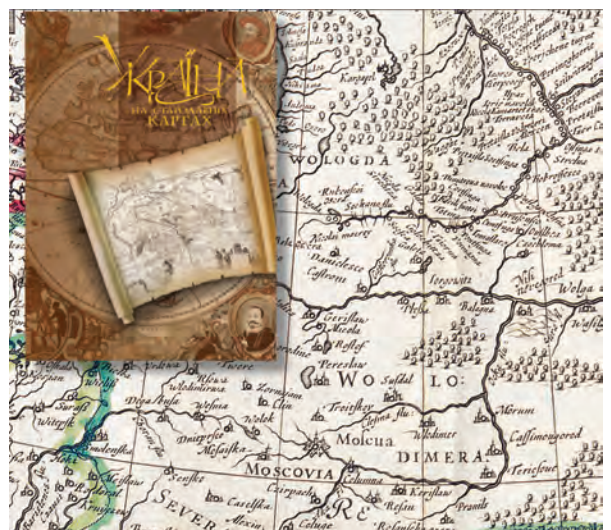
Рис. 6. Україна на стародавніх картах. Середина XVII – друга половина XVIII ст.