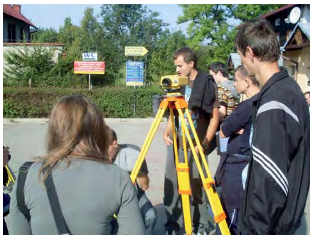
Rys. 2. Rozpoczęcie pomiarów w podnóża masywu Szczelińca Wielkiego. Pomiar niwelatorem DL-102C

Pomierzone różnice wysokości poprawiono o poprawki termiczne. Poprawione przewyższenia przedstawiono w tabeli 2.