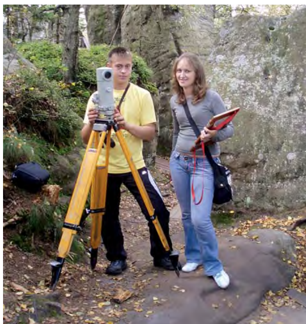
Rys. 4. Pomiary w partiach krawędziowych masywu Szczelińca Wielkiego. Pomiar niwelatorem Ni007