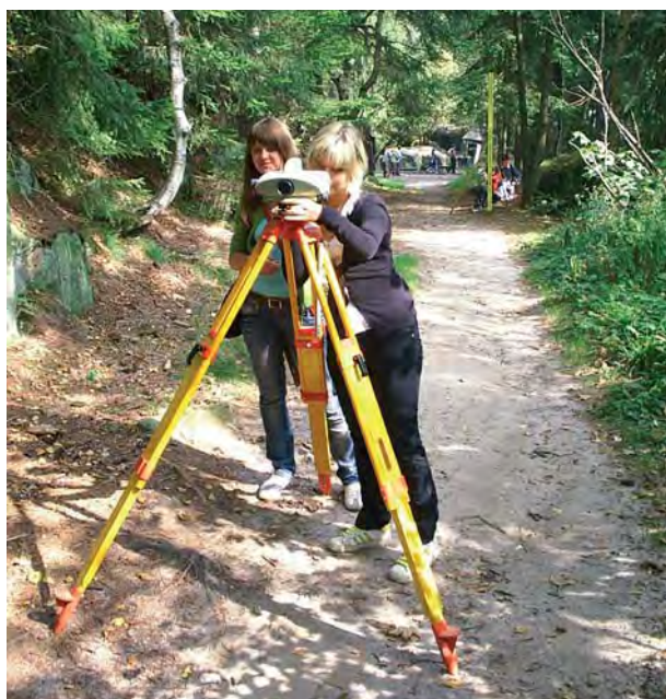
Rys. 3. W drodze na przełęcz pomiędzy Wielkim a Małym Szczelińcem. Pomiar niwelatorem Leica DNA03