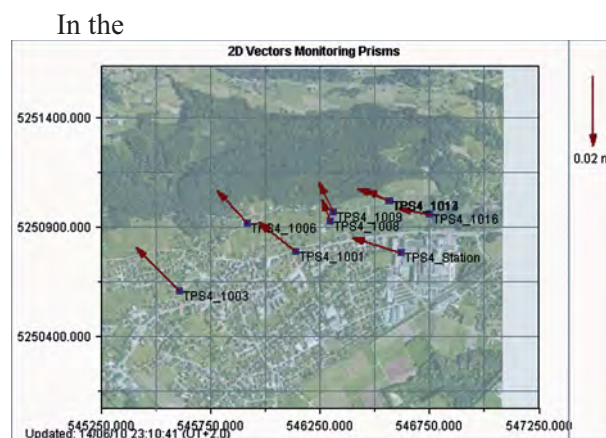
Rys. 5. Widok okna dialogowego aplikacji GeoMoS Web prezentującego wyniki pomiaru przemieszczeń (Leica Geosystems)

Obecnie rozwijane są zdalne serwisy monitoringu strukturalnego (rys. 4 i 5), w przypadku których użytkownik łączy się z centrum zarządzania (serwer aplikacyjny i bazodanowy) za pomo-