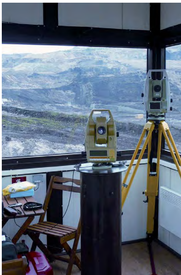
Rys. 3. Widok wnętrza kontenera pomiarowego z dwiema zautomatyzowanymi stacjami tachimetrycznymi

ca przeglądarki internetowej. Konfiguracja instrumentarium, definiowanie połączeń czy określanie progów bezpieczeństwa dla systemu powiadomienia o wykrytych zdarzeniach odbywa się na obiekcie w fazie uruchamiania projektu. Operator systemu monitoringu posiada kod logowania oraz hasło, za pomocą których uzyskuje zdalny dostęp. Wyniki prowadzonych prac obserwuje na ekranie komputera zlokalizowanego w dowolnym miejscu i w dowolnym czasie. Architektura systemowa, według której odbywa się cały proces odpowiada znanym rozwiązaniom geoinformatyki, które znajdują swoje zastosowanie w budowaniu infrastruktury danych przestrzennych (systemy informacji o terenie, geoportale).