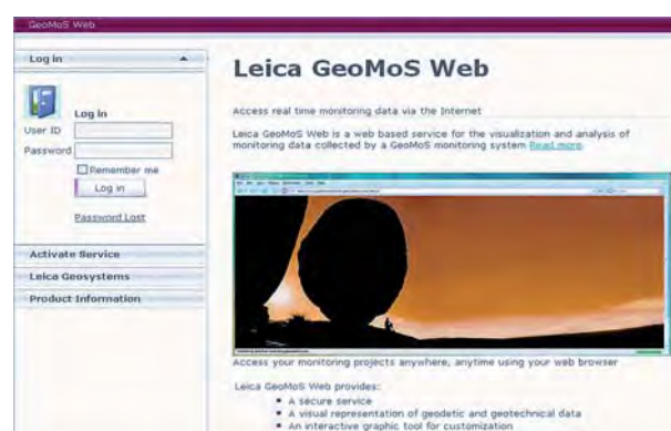
Rys. 4. Widok okna dialogowego aplikacji "GeoMoS Web" (Leica Geosystems)

ca przeglądarki internetowej. Konfiguracja instrumentarium, definiowanie połączeń czy określanie progów bezpieczeństwa dla systemu powiadomienia o wykrytych zdarzeniach odbywa się na obiekcie w fazie uruchamiania projektu. Operator systemu monitoringu posiada kod logowania oraz hasło, za pomocą których uzyskuje zdalny dostęp. Wyniki prowadzonych prac obserwuje na ekranie komputera zlokalizowanego w dowolnym miejscu i w dowolnym czasie. Architektura systemowa, według której odbywa się cały proces odpowiada znanym rozwiązaniom geoinformatyki, które znajdują swoje zastosowanie w budowaniu infrastruktury danych przestrzennych (systemy informacji o terenie, geoportale).