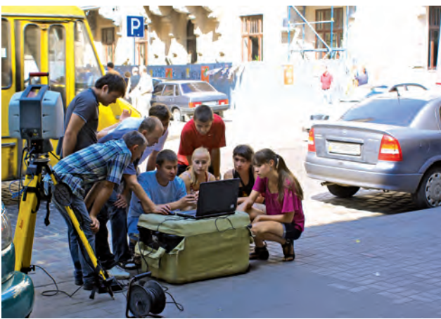
Рис. 2. Етап лазерного сканування споруди