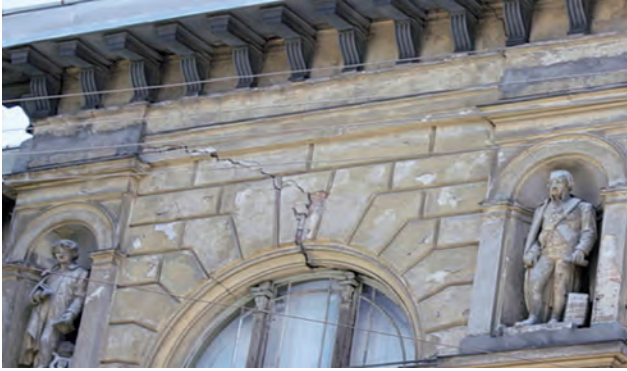
Рис. 1. Частина будинку з яскраво вираженими руйнаціями