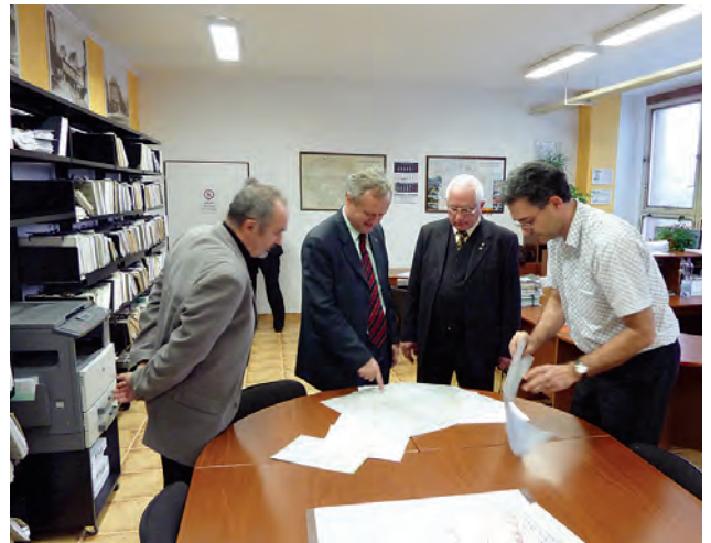
Під час візиту в Чехію