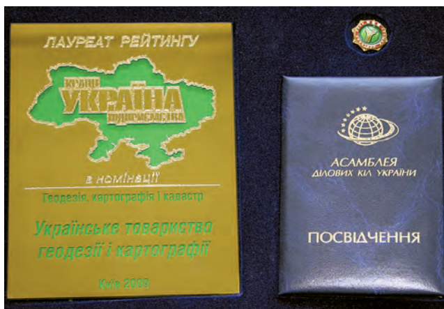
Нагорода Українському товариству геодезії і картографії