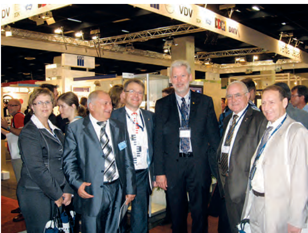
Члени Української делегації на конгресі INTERGEO 2010 (Кельн, ФРН). У центрі Президент DVW професор Карл Фрідріх Тоне