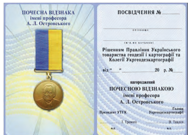
Посвідчення почесної відзнаки імені професора А.Л. Островського