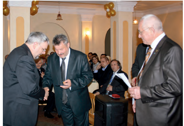
Нагородження професора Вільгельма Гегера (ФРН) на МНГК "Геофорум – 2010"