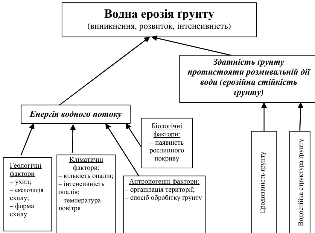
Рис. 1. Фактори виникнення, розвитку та інтенсивності водної ерозії

Обидві названі вище головні причини виникнення, розвитку та інтенсивності водної ерозії (енергія водного потоку та здатність ґрунту протистояти розмивальній дії води), своєю чергою, залежать від низки факторів, які поділяються на зовнішні та внутрішні (рис. 1).