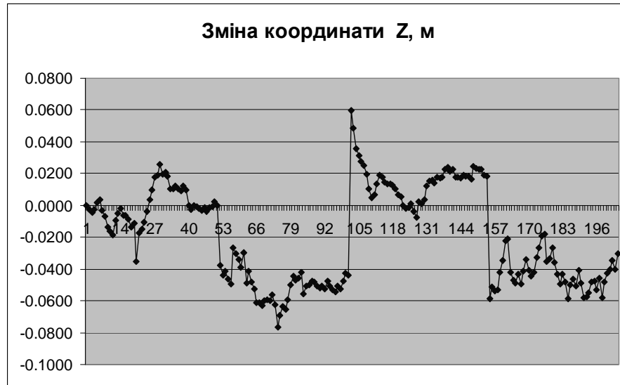
Рис. 2. Зміна координати Z ( Z_{вим.}^i - Z_{FRAN} ) за період спостережень

Нами обчислено різниці між координатами референцної станції FRAN, які були визначені із тривалих статичних спостережень (більш як за півроку), та отримані із щохвилинних RTK спостережень. Всього одержано близько 200 таких різниць координат за всі чотири сеанси спостережень. Для прикладу, на рис. 2 наведено зміну (різниці) координати Z , де досить чітко проявляються сеанси спостережень з кроком близько 50 вимірних значень. Саме для кожного із сеансів було визначено усереднені координати, за якими і отримано остаточні зміни координат між сеансами I і III (із станцією FRAN) та II і IV (без станції FRAN). У табл. 2 наведено зазначені зміни.