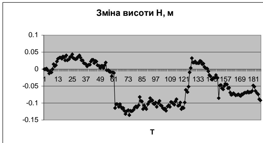
Рис. 4. Зміна висоти H ( H_{\text{вим.}}^i - H_{\text{FRAN}} ) за період спостережень

Треба зазначити, що виконані у червні дослідження (24 і 26 червня) повністю повторювали попередні раніше. Їхньою метою було підтвердити отримані нами оцінки тропосферного впливу в мережі ZAKPOS. Ці дослідження також склалися із чотирьох сеансів по 60 визначень координат в кожному. Відмінністю було лише те, що знаходили зміну геодезичних координат. На рис. 4 наведено зміну висоти H . Як видно із рисунка, характер зміни і самі величини є близькими до раніше одержаних.