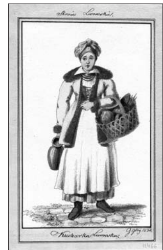
Юрій Глоговський. Львівська кухарка. Львів, 1834 р.

Другий твір, виконаний Ю. Глоговським з огляду на живопис у костелах Львова, — портрет канівського старости Миколи Потоцького (1712—1782), постать якого, до речі, знайшла широке відображення у художній літературі XVIII—XIX ст. Обійнявши посаду канівського старости, волинський магнат обрав Канів своєю резиденцією. Для