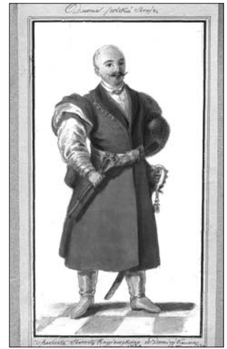
Юрій Глоговський. Портрет канівського старости Миколи Потоцького. Львів, 1834 р.

На задньому плані видніється панорама Львова — вільне трактування княжого міста. Портрет князя, виконаний Л. Долинським, розміщувався у Святоюрському монастирі у Львові до 1815 р., звідти його передали монастиреві при церкві св. Онуфрія 11 . У першій половині XIX ст. у широких колах громадськості цей портрет розглядався як найбільш автентичний 12 . Відомо, що його позичали в Петербург для створення копії. Ю. Глоговський, зберігаючи