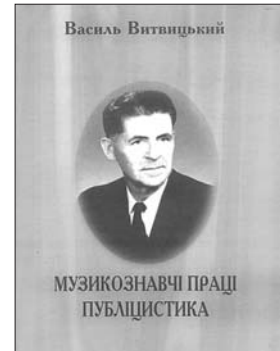
Обкладинка досліджень Василя Витвицького „Музикознавчі праці. Публіцистика“, серед яких розвідки про Ф. Шопена. Львів, 2003 р.

Музика Фридерика Шопена увійшла вагомою складовою до музичної культури України, і це є однією з найкращих сторінок в історії взаємин українського та польського народів.