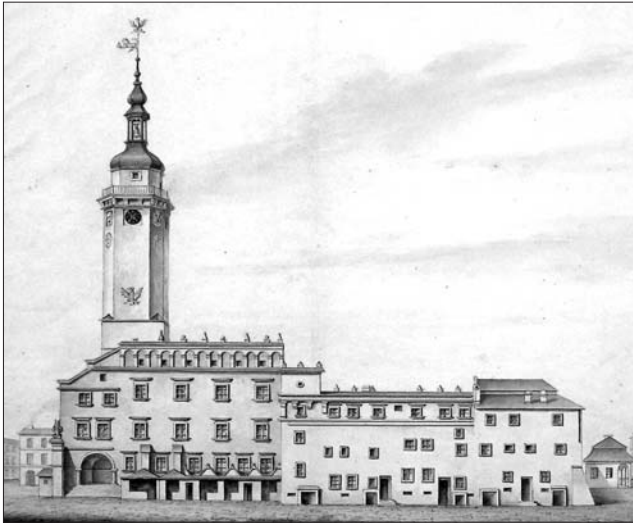
Юрій Глоговський. Львівська ратуша. Львів, бл. 1826 р.

таких промислів, як садівництво, квітникарство. Львів'янки кінця XVIII — початку XIX ст. одягнені у білі сорочки та червоні шнуровані безрукавки.