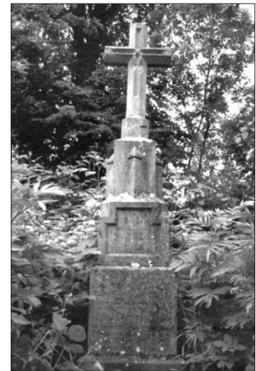
Нагробний пам'ятник Ізидорові Глинському на цвинтарі у с. Буцнівці

Він ініціював створення Товариства тверезости, про що свідчить грамота тодішнього митрополи-