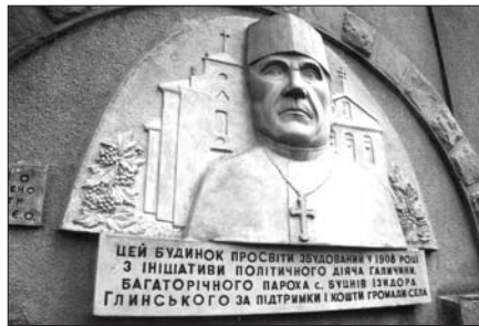
Пропам'ятна таблиця Ізидорові Глинському на будинку „Просвіти“ у с. Буцневі