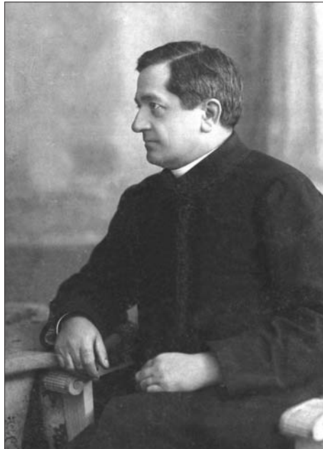
Ізидор Глинський. Початок XX ст.

Цього року виповнюється 150 років від народження священника, громадсько-культурного діяча, краєзнавця, члена НТШ (з 1893 р.) Ізидора Глинського. Його подвижницька діяльність на культурно-освітній ниві, яка нині майже забута, потребує гідної оцінки не лише за вагомих внесок у розбудову соціально-культурного поступу селянства на Тернопільщині, але й ширше — за утвердження національного духу і культурних цінностей власного народу наприкінці XIX — першої половини XX ст. Ізидор Глинський, без сумніву, — зразок духовної діяльності священника в селі. Він не належав до постатей першої величини, але був одним з-поміж тих особистостей, чия щоденна самовіддана праця підготовляла ґрунт для здійснення радикальних змін у націотворчому процесі зазначеного періоду у політиці, культурі та мистецтві. Ізидор Глинський — один із тих, у кого була глибока внутрішня потреба служити людям, що породжувало в житті рідного народу культ праці, яку пізніше ці люди сповідували до кінця свого життя. Для села Ізидор Глинський став „цілою епохою”, „духовним символом” 1 , а для української спільноти — вірним оборонцем національної сутності народу. Зберігся великий, майже недосліджений, архів родини Глинських, в якому на окрему увагу заслуговує листування о. Ісидора з галицькими вченими, громадськими діячами і письменниками, зокрема Володимиром Шухевичем, Костем Паньківським, Корнилом Устияновичем, Богданом Янушем, Олександром Барвінським (і його родиною), Йоси-