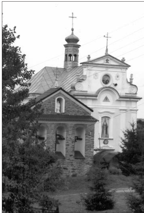
Церква і дзвіниця у с. Буцневі. Сучасний вигляд

стиансько-суспільного руху, до якого належала значна частина галицького духовенства, і в програмах політичних партій, які він очолював (Католицький русько-народний союз, пізніше — Християнсько-суспільний союз), роль Церкви в укріпленні морально-духовних основ суспільства була надзвичайно вагомою. Їхня програма дій була зосереджена навколо питань національної просвіти народу, його освіти та духовності, і саме парох мав взяти на себе обов'язки громадського лідера, оскільки „священик — єдина особа на селі, що поєднувала українську національність, університетську освіту, економічну незалежність та санкціоновану владу. Підтримка священниками національного руху відіграла вирішальну роль у його поширенні серед мас” 6 . Восени 1895 р. у Римі відбулися ювілейні урочистості з нагоди 300-ліття Берестейської унії, і в числі української делегації