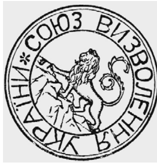
Печатка Союзу визволення України