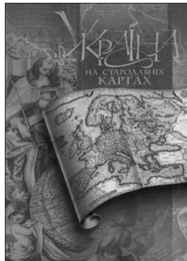
Україна на стародавніх картах