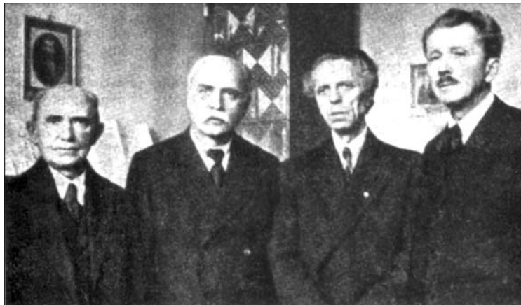
Зустріч українських композиторів у Львові. Зліва направо: Філарет Колесса, Левко Ревуцький, Василь Барвінський, Станіслав Людкевич. 1940 р.

В. Барвінський виступав також як диригент, а як педагог, крім гри на фортеп'яно, викладав теоретичні дисципліни. Був добрим музикознавцем і