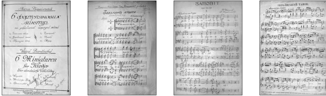
Сторінки нотних видань із різних років Василя Барвінського

на честь святкування ювілею М. Лисенка, цей навчальний заклад саме у 1915 р. отримав ново-збудоване на зібрані кошти приміщення, але його директор С. Людкевич як офіцер австрійської армії мусив іти на війну.