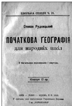
Обкладинка праць С. Рудницького „Україна і народ“ (Відень, 1916 р.) та „Початкова географія для народніх шкіл“ (Київ; Львів; Відень, 1919 р.)