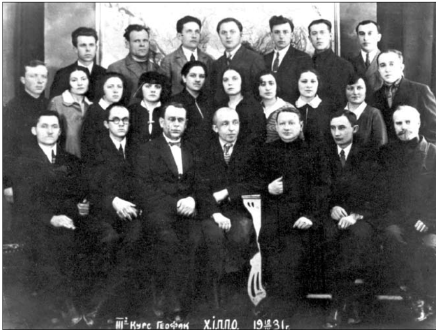
Степан Рудницький в колі співпрацівників і студентів Харківського інституту професійної педагогічної освіти. Харків, 1931 р.

Не всі задуми в галузі картографії вдалося реалізувати С. Рудницькому. Проте за його авторством і безпосереднім науковим керівництвом підготовлено і видано велику кількість настінних і настінних карт. Особливо продуктивними були 1918—1920 рр. (час існування ЗУНР). Назвемо хоча б першу настінну карту України — „Стінна фізична карта України“ в масштабі 1:1 000 000,