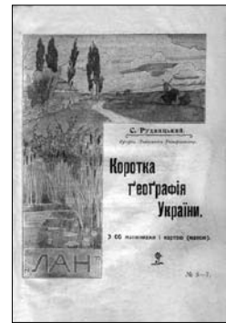
Обкладинка підручника С. Рудницького „Коротка географія України“. Київ; Львів, 1910 р.

Проблема віднесення географії до певної системи наук — природничих чи суспільних — завжди була каменем спотикання в її історії. Вона проявлялась у так званому моністичному чи дуалістичному розв'язанні. Деякі географи, особливо у стародавні