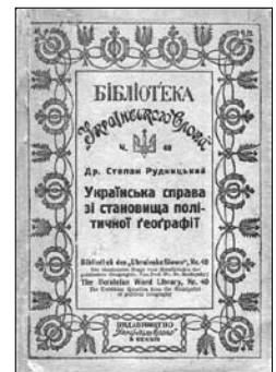
Титульні сторінки праць С. Рудницького „До основ українського націоналізму“ (Відень; Прага, 1923 р.) та „Українська справа зі становища політичної географії“ (Берлін, 1923 р.)